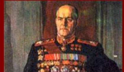
Маршал Георгий Константинович Жуков