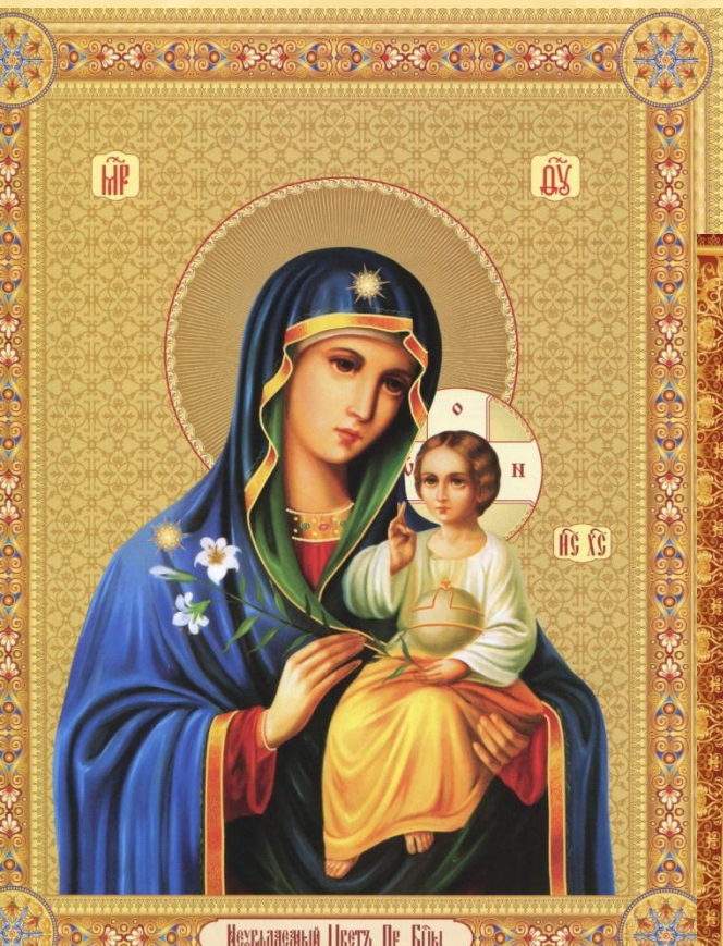
Незлобивый Цветы Пр. Блвы