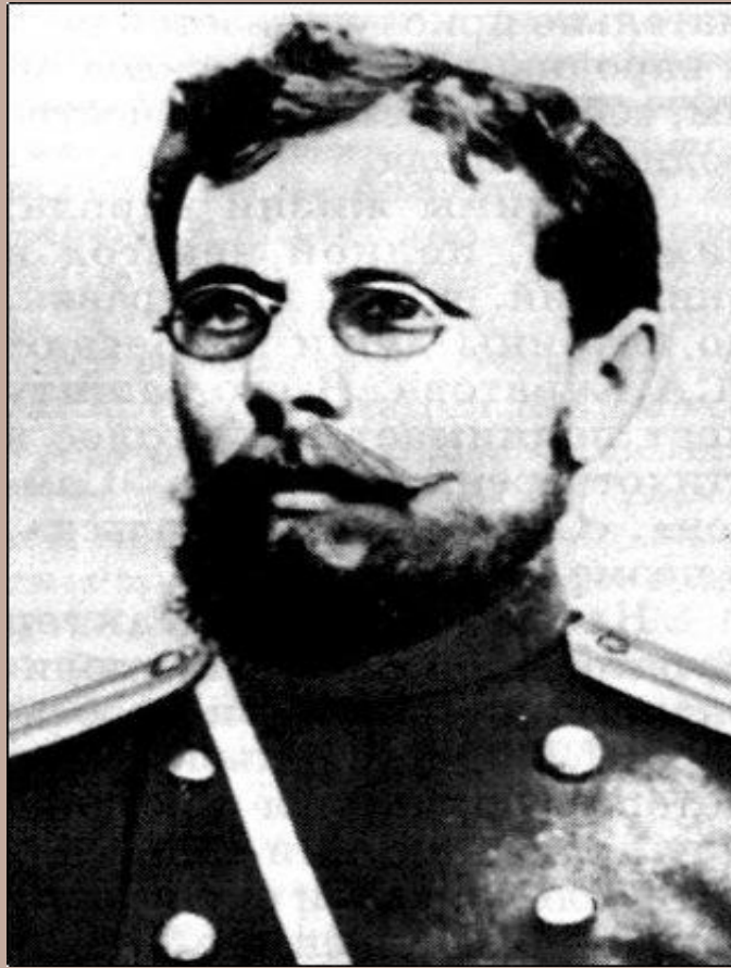
КУРАТОВ ИВАН АЛЕКСЕЕВИЧ