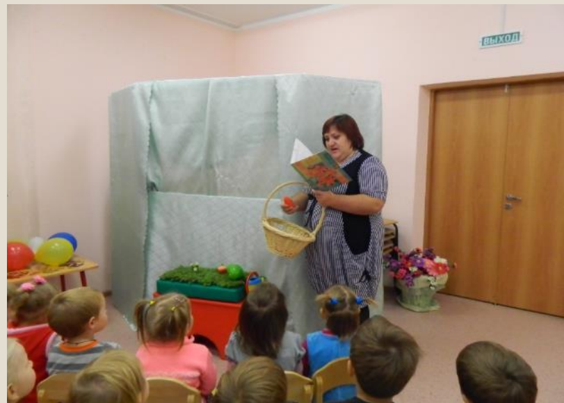
Осень к нам пришла