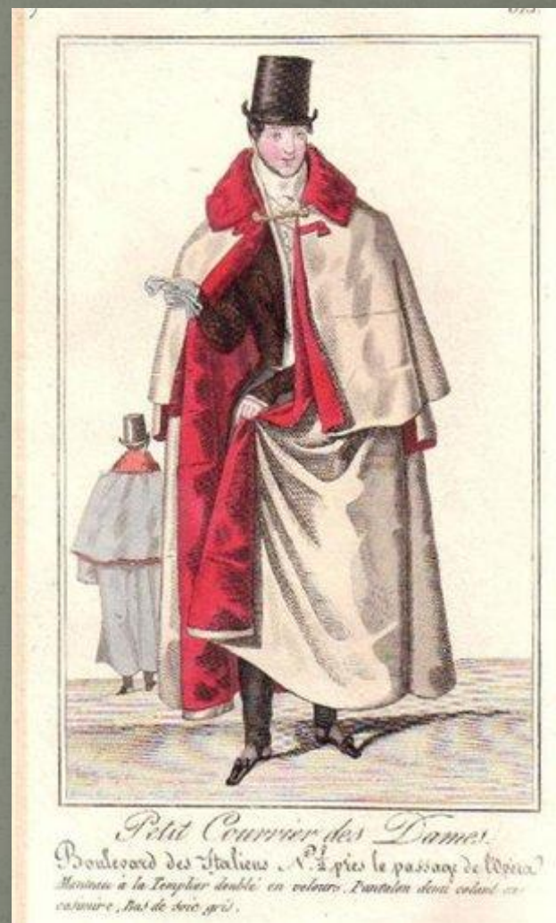
Petit Courrier des Dames. Boulevard des Italiens. A. à près le passage de l'Opéra. Manteau à la Tempier double en velours. L'entolien deux couleurs en caoutchouc, hat de deux gris.