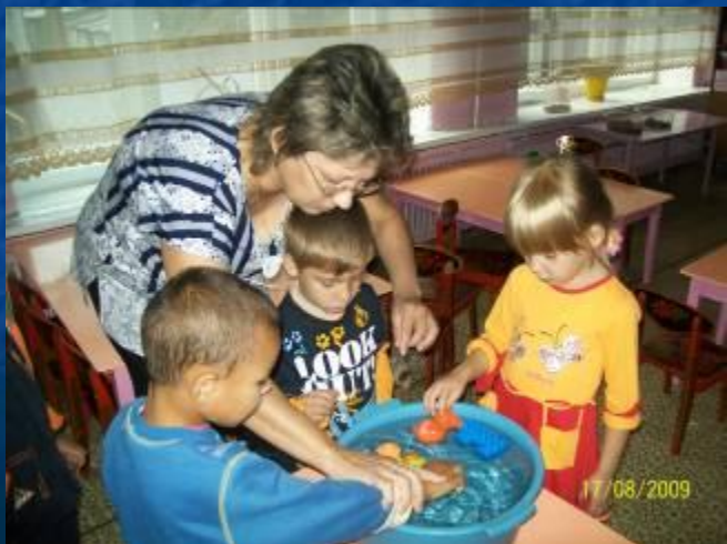
Тонет - не тонет