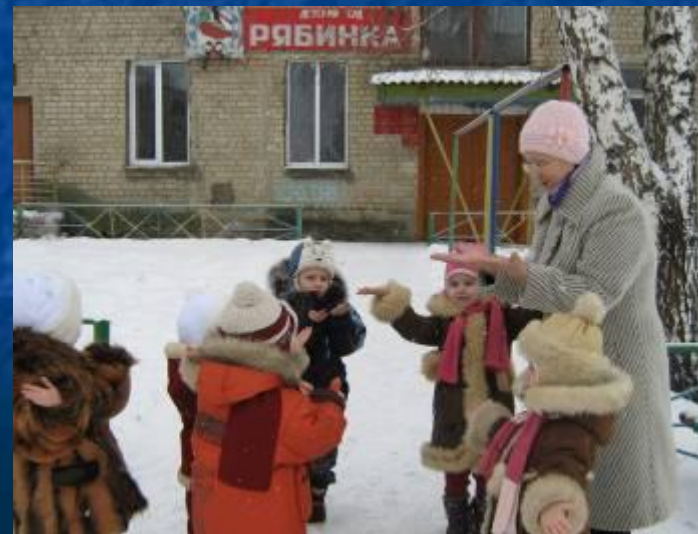
Изучаем свойства снега