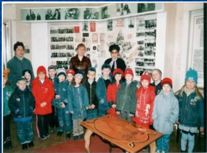
В музее трудовой славы светотехнического завода