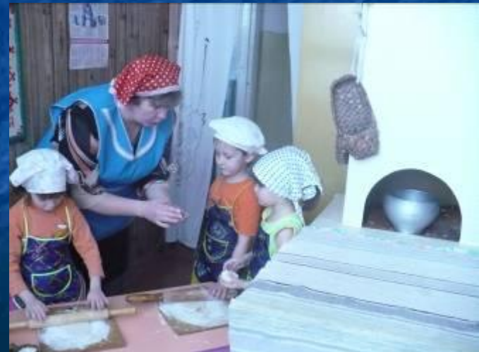
"Испечем мы пирожки"