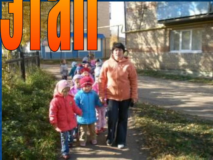
Знакомимся с улицами родного поселка