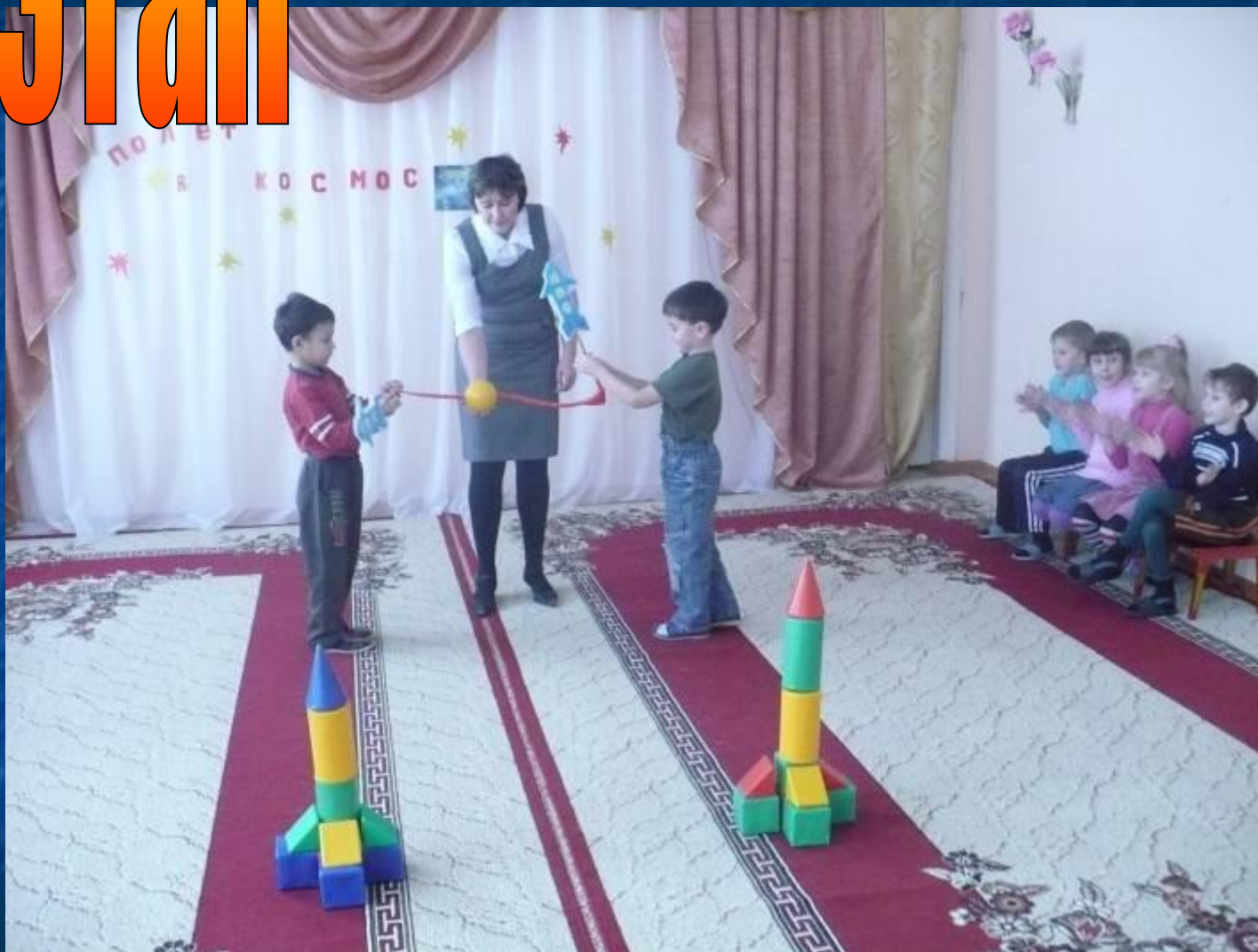
"Полет в Космос"