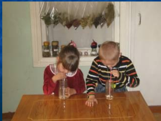
Измеряем объем легких