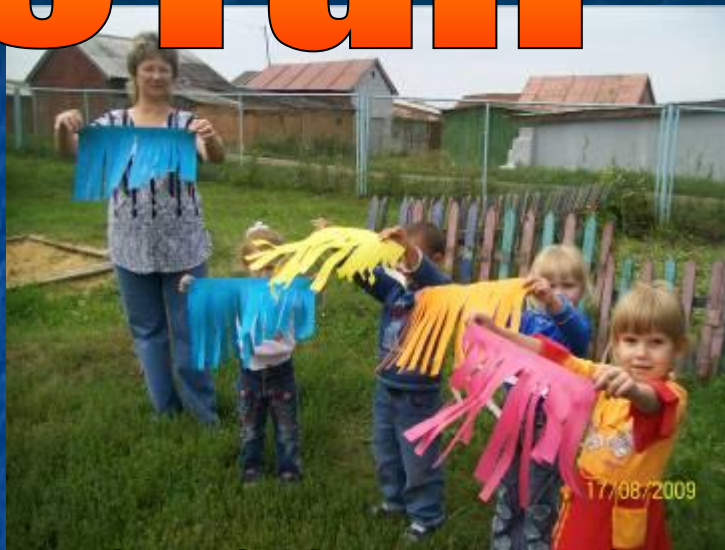
Откуда дует ветер?