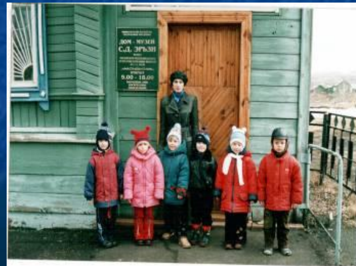
Экскурсия в дом-музей С.Д.Эрьзи