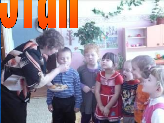
"Угадай на вкус"