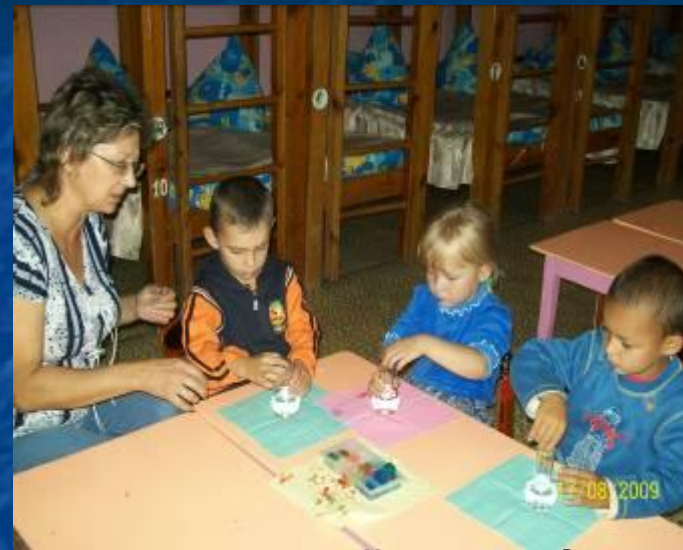
Изучаем свойства воды