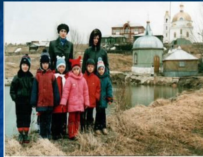
У святого источника