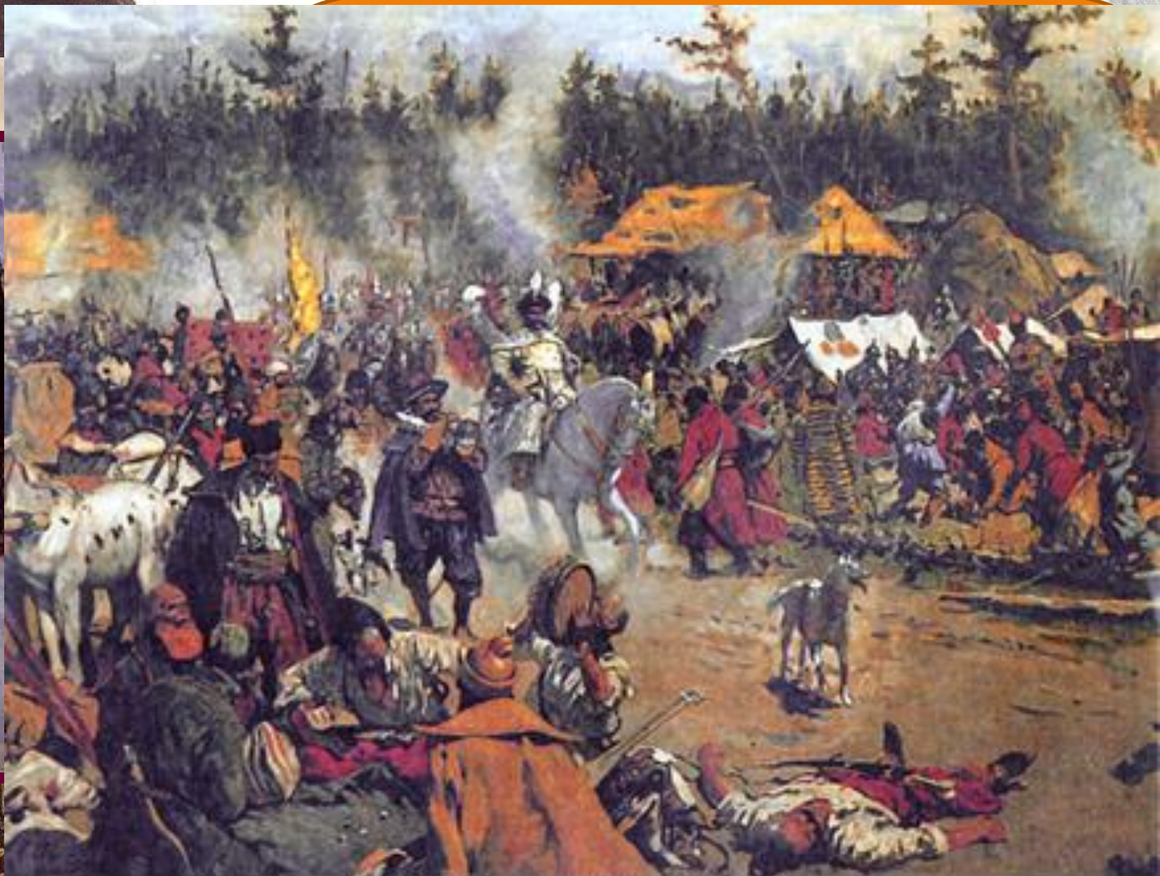
С.В. Иванов. "В смутное время"