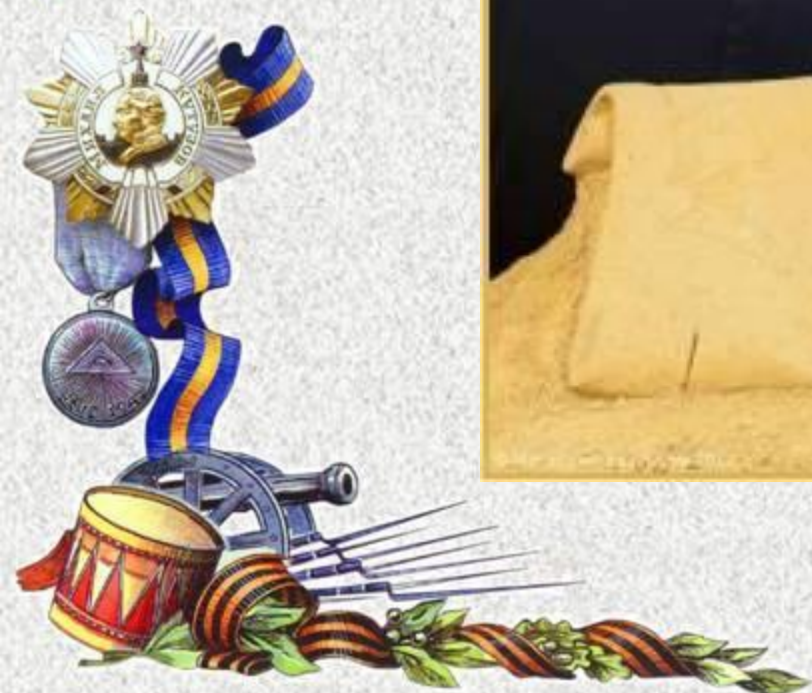
Скульптура из песка