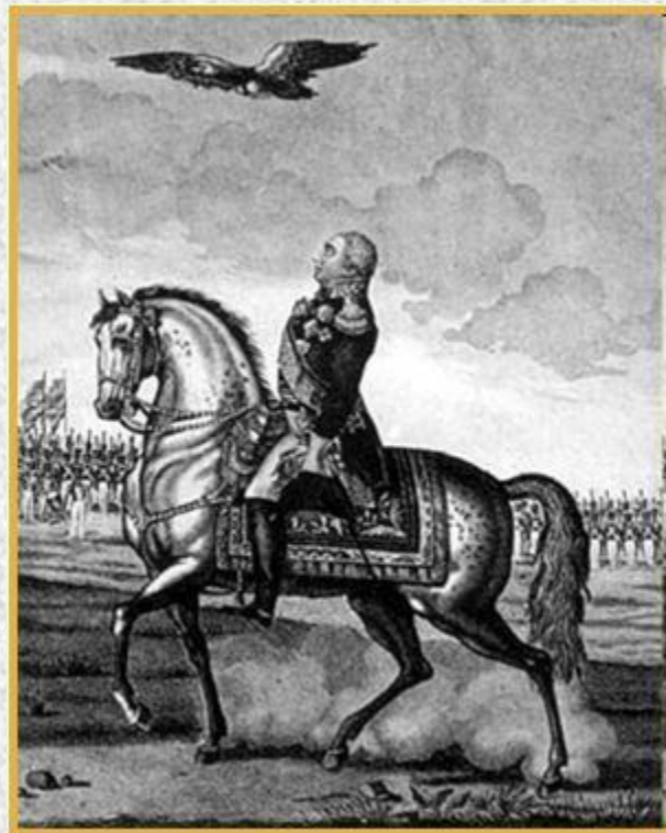
Князь Кутузов прибывает в расположение русских армий (гравюра)

17 августа светлейший князь М.И.Кутузов возглавил русские войска у села Царево Займище, близ Гжатска.