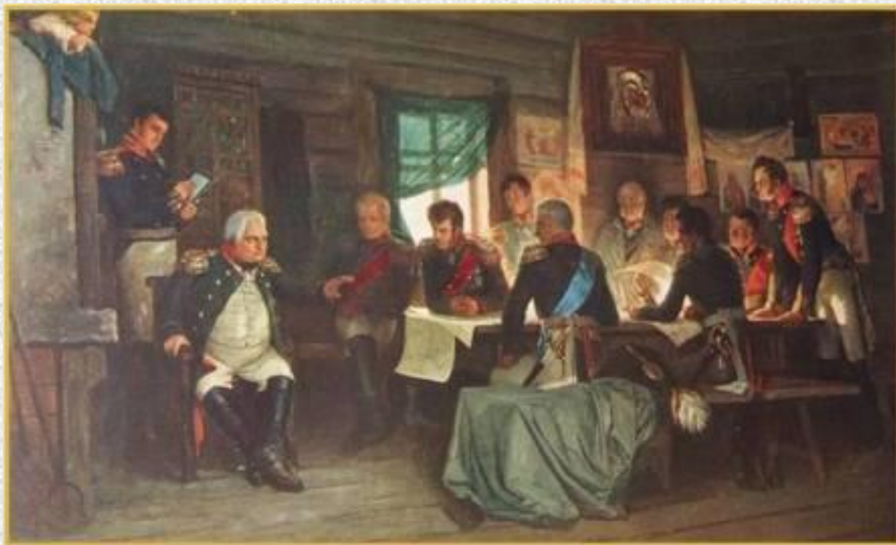
Кившенко А.Д. Военный совет в Филях. 1812.

«Чтобы спасти Россию, надо сжечь Москву».