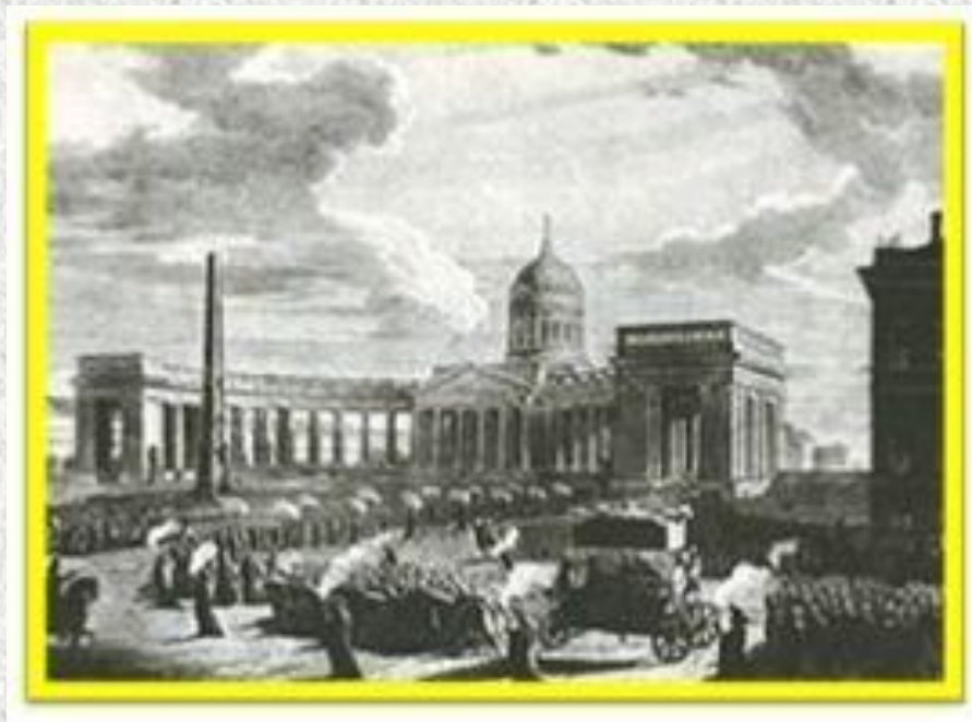
Гравюра М.Н. Воробьева «Похороны М.И. Кутузова», 1814 г.