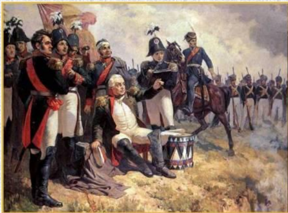
Шепелюк А.П. Михаил Кутузов во время Бородинского сражения. 1951.