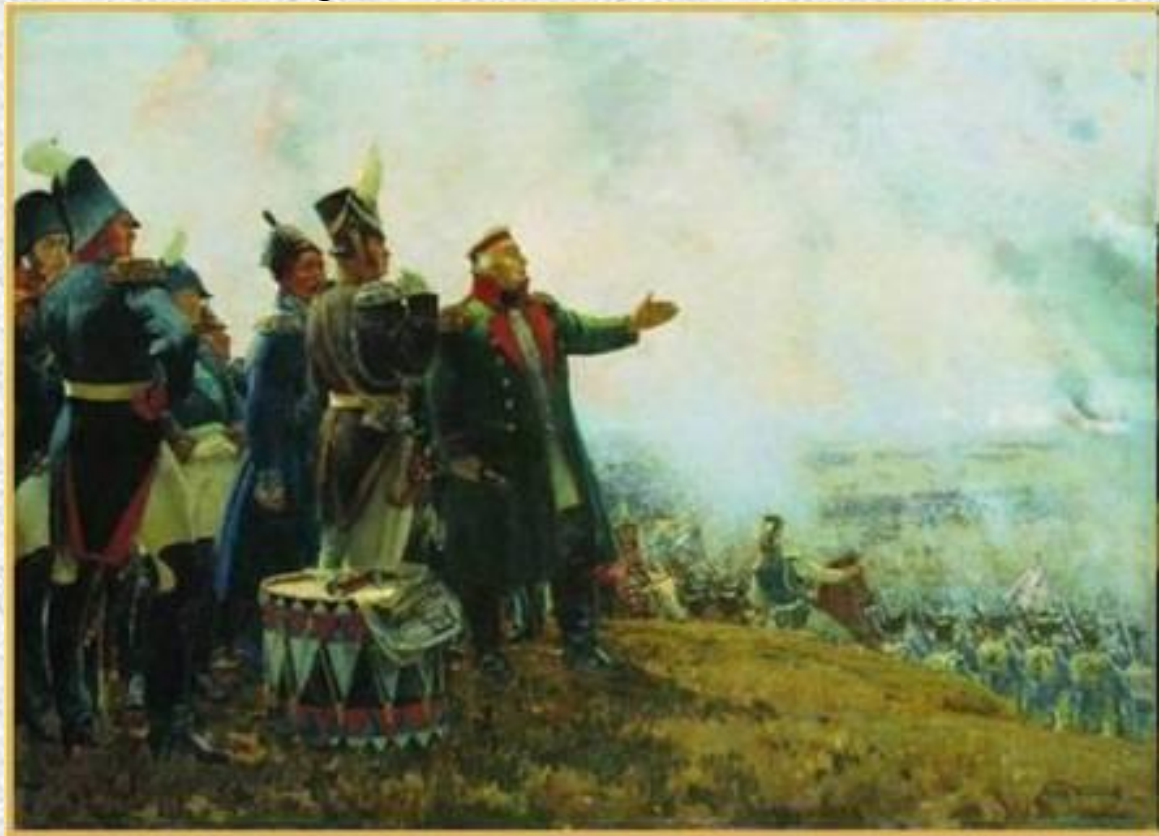
Кутузов на Бородинском поле. 1952. Холст, масло. 180 x 255 см. Музей-панорама "Бородинская битва"