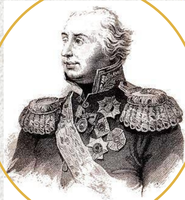
Гравюра Г.Робинсона. М.И.Кутузов. 1810 год.