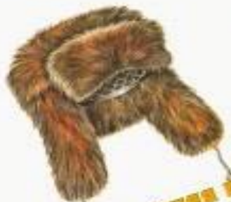
Детская зимняя шапка