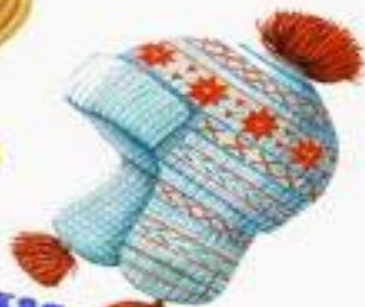
Детская вязаная шапка