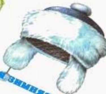
Дамская зимняя шапка