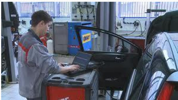
Человек - техника

«Тот, кто с детства знает, что труд есть закон жизни, кто смолоду понял, что хлеб добывается только в поте лица, тот способен к подвигу, потому что в нужный день и час у него найдется воля его выполнить и силы для этого» (Жюль Верн)