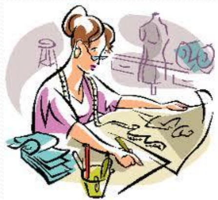
Человек – художественный образ