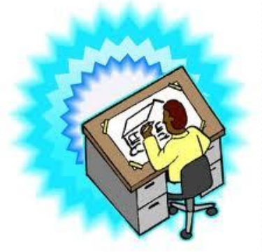
Человек – знаковая система