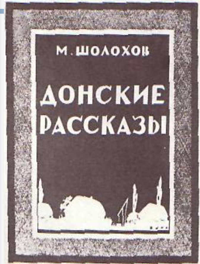
Обложка первого издания.