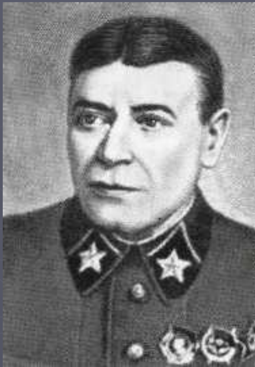
ШАПОШНИКОВ Борис Михайлович (20.09.(02.10 ).1882-26.03.1945 гг.) — военачальник, Маршал Советского Союза.