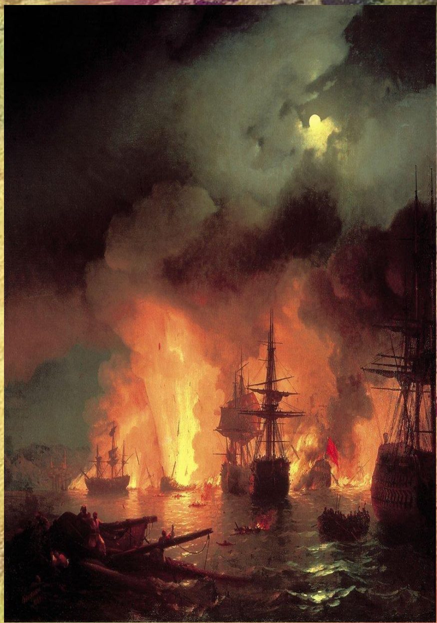
Чесменский бой. Картина И. К. Айвазовского, 1848