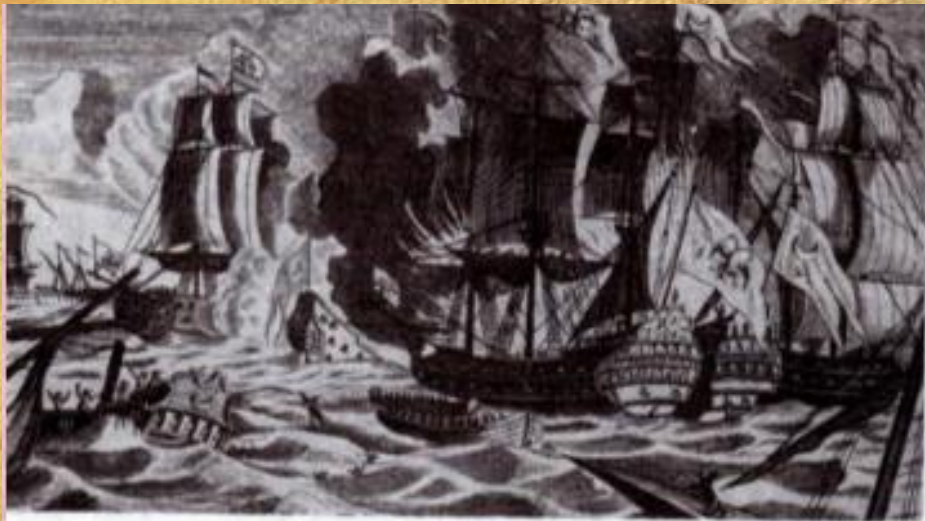
Бой в Хиосском проливе — первый этап Чесменского сражения. Гравюра XVIII в.