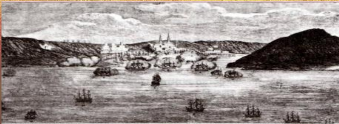
Чесменский бой. Гравюра. XVIII в.