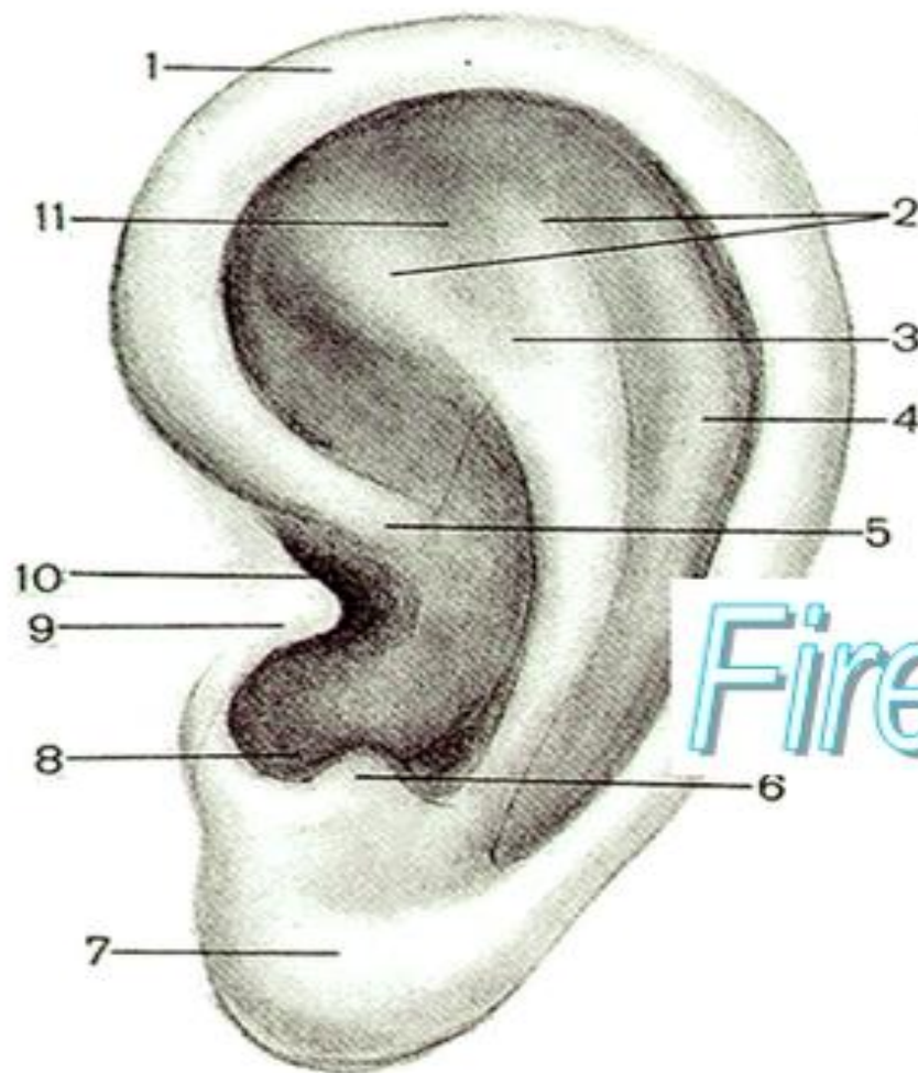
Рис. 210. Ушная раковина, auricula, левая.