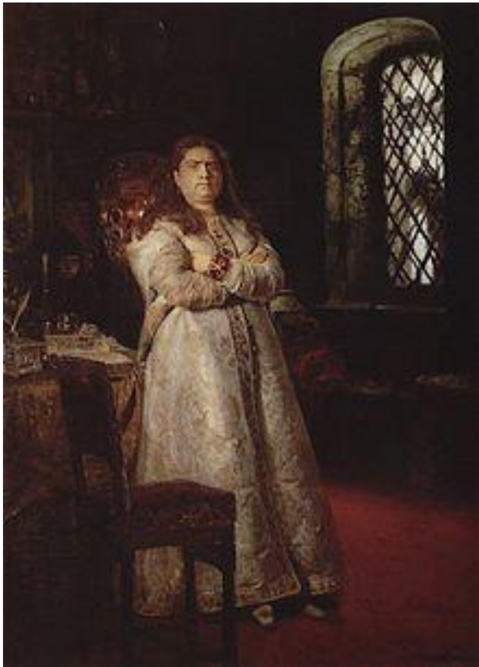
Царевна Софья Алексеевна в Новодевичьем монастыре. Картина Ильи Репина