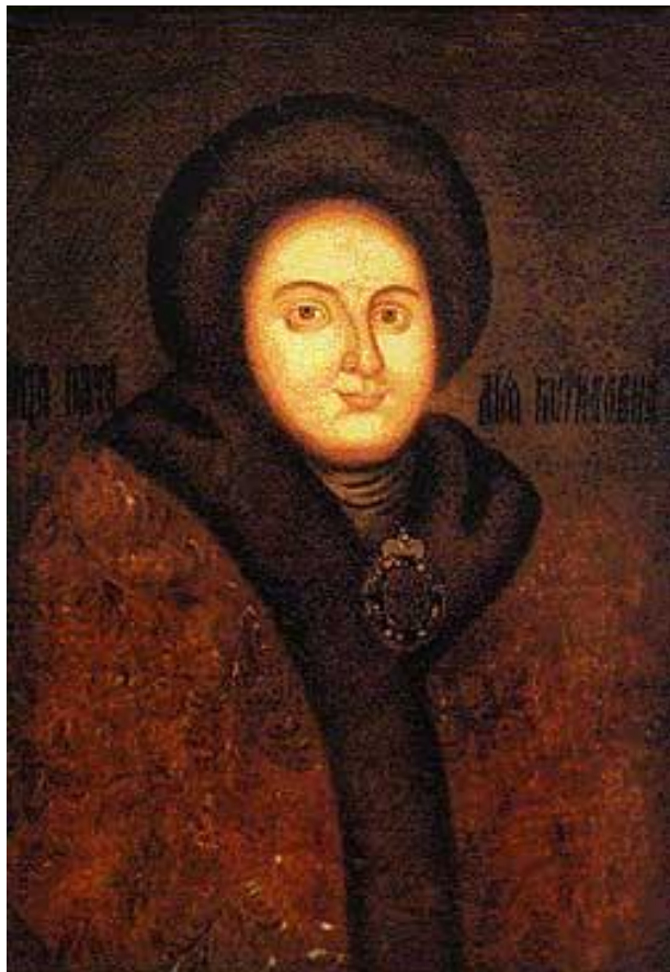
Евдокия Федоровна Лопухина