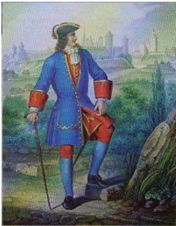
Офицер лейб-гвардии Семёновского полка с 1700 по 1720 год.