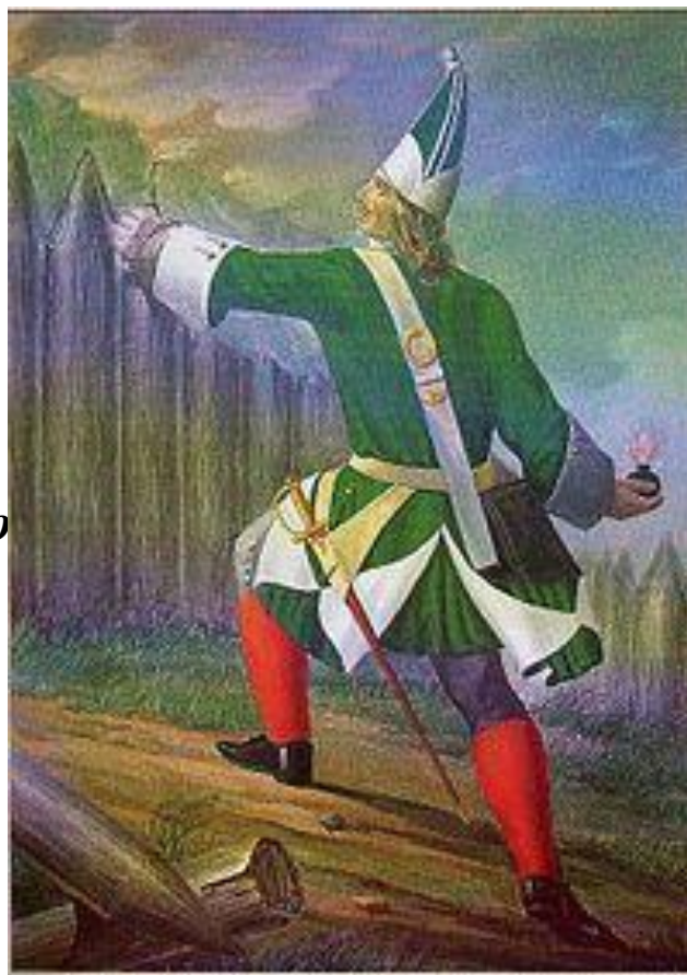
Гренадер пехотного полка с 1700 по 1732 год.