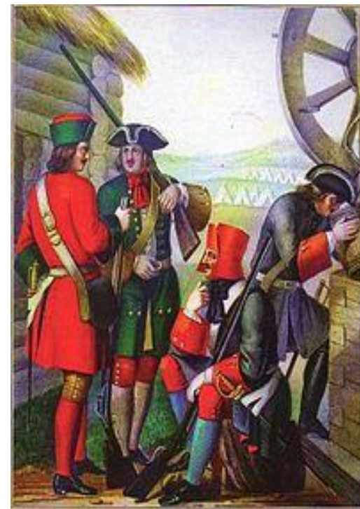
Фузелёры пехотных полков с 1700 по 1720 год.