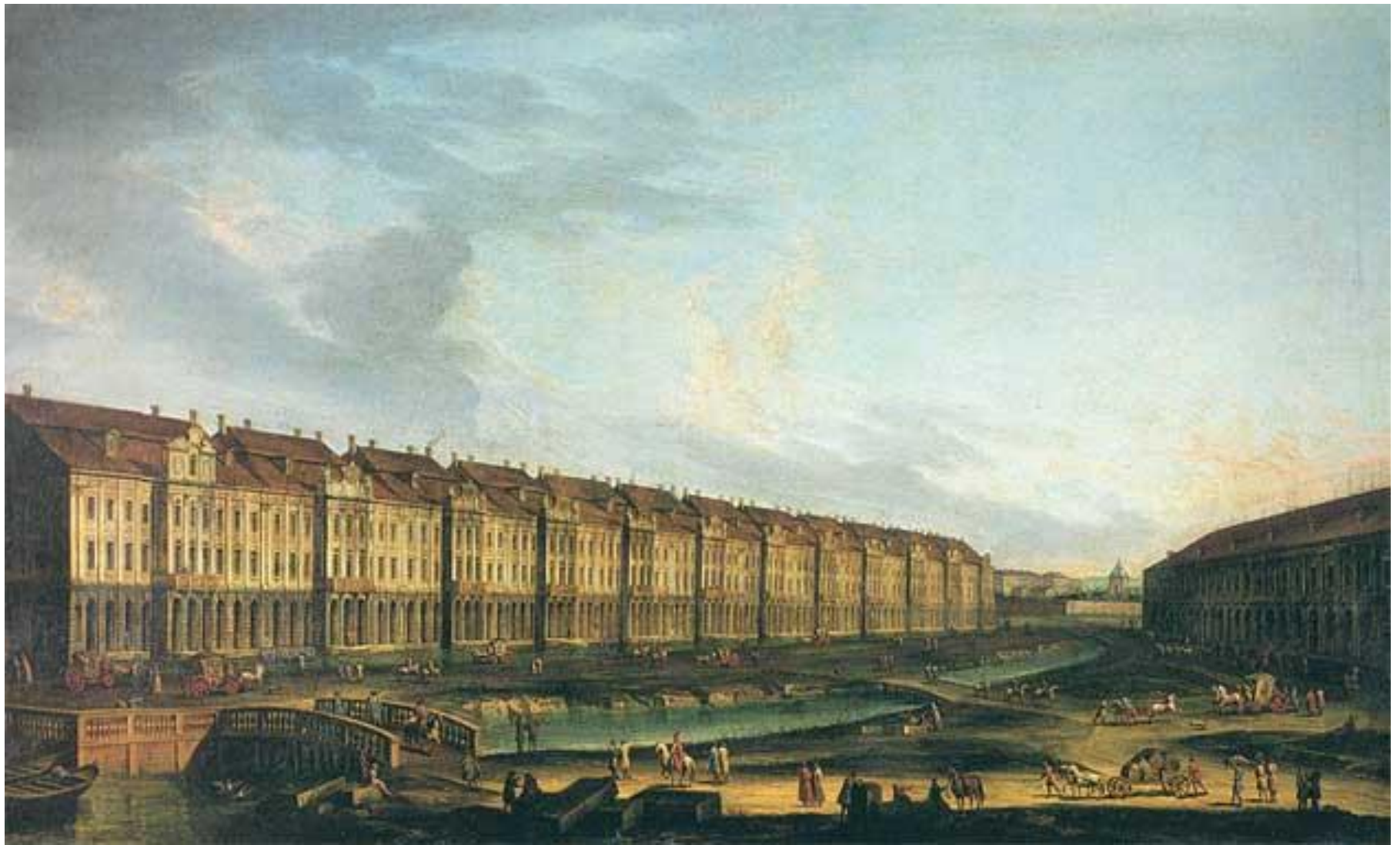
Здание Двенадцати коллегий в Петербурге. Неизвестный художник третьей четверти XVIII века. По гравюре Е. Г. Внукова с рисунка М. И. Махаева