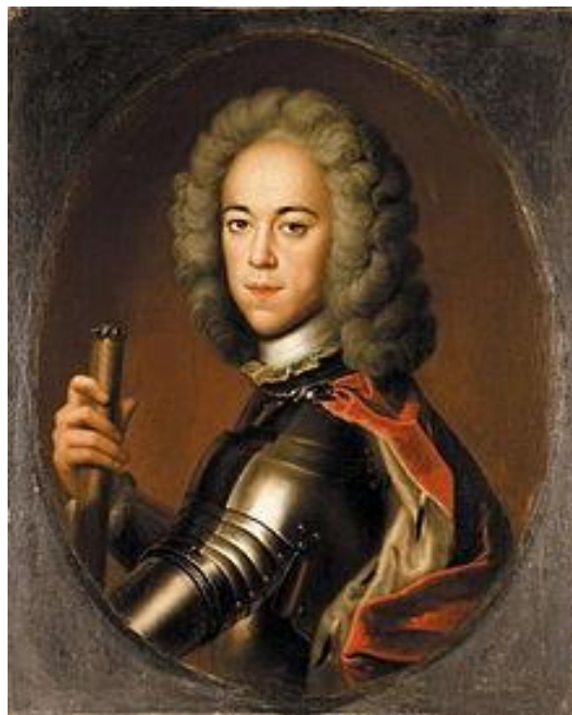
Царевич Алексей 1690 - 1718