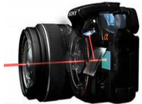
Translucent Mirror Technology