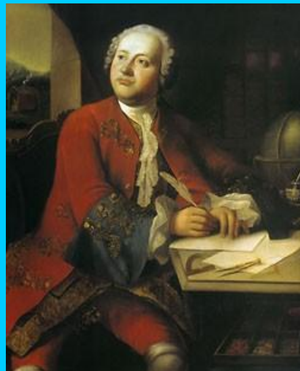
Вортман, Христиан-Альберт. Портрет М.В. Ломоносова. Не позднее 1784 г. ГИМ