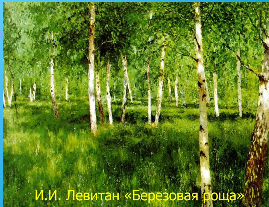
И.И. Левитан «Березовая роща»

Понаблюдайте, как повторение гласных звуков создает настроение легкой грусти и нежности. Запишите отрывок.