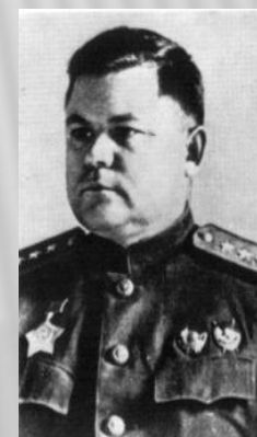
Ватутин Н. Ф. (1901-1944)