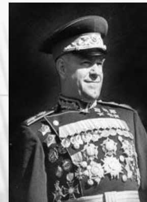
Жуков Г.К. (1896-1974)