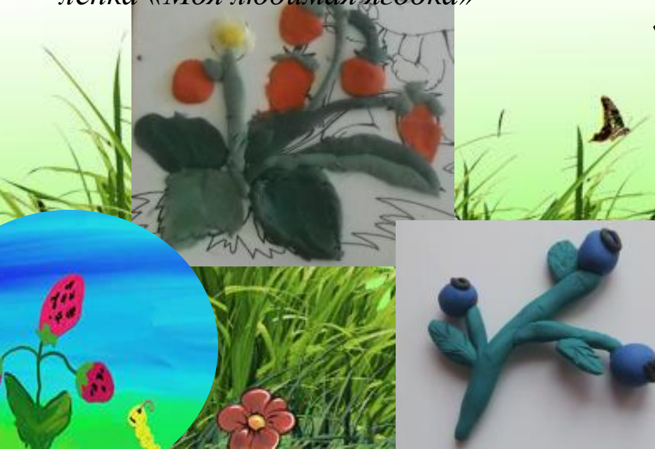
апликация масок к сказке «Земляничка»