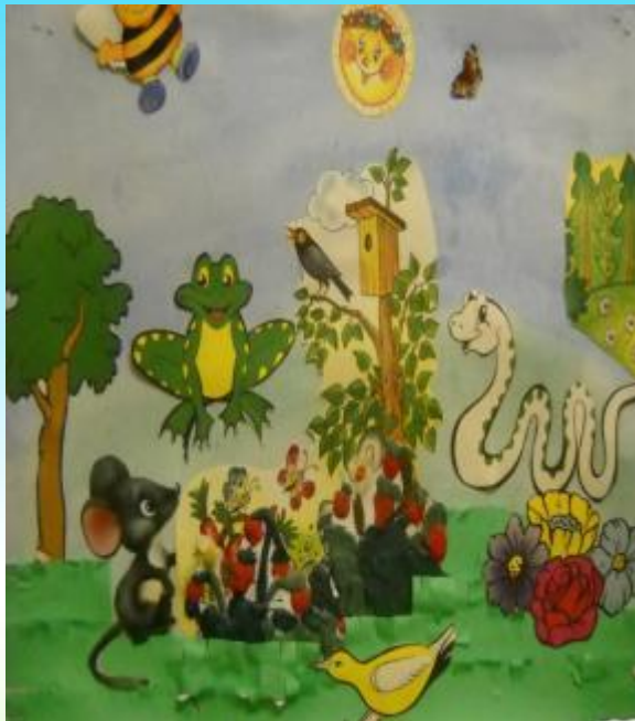
афиша виде коллажа