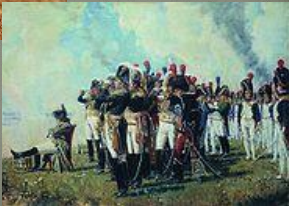
Наполеон осматривает позиции предстоящего боя.