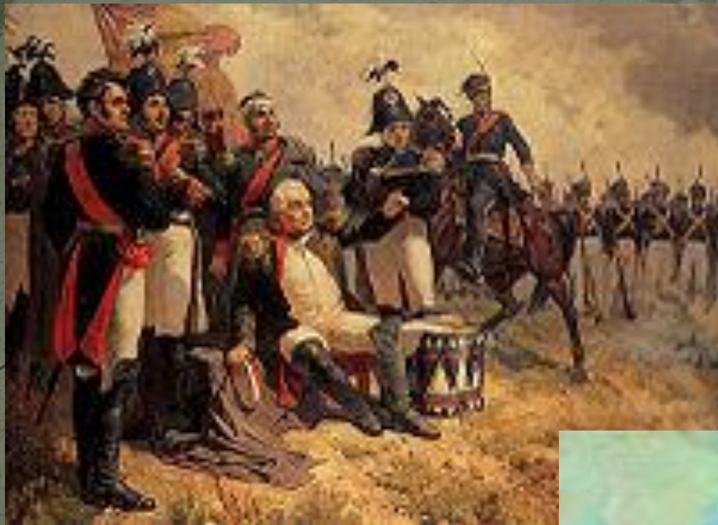
М. И. Кутузов на командном пункте в день Бородинского сражения.