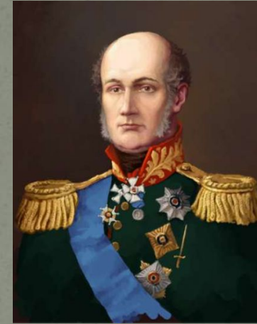
М.Б.Барклай-де =Толли — полководец, герой Отечественной войны 1812 года.