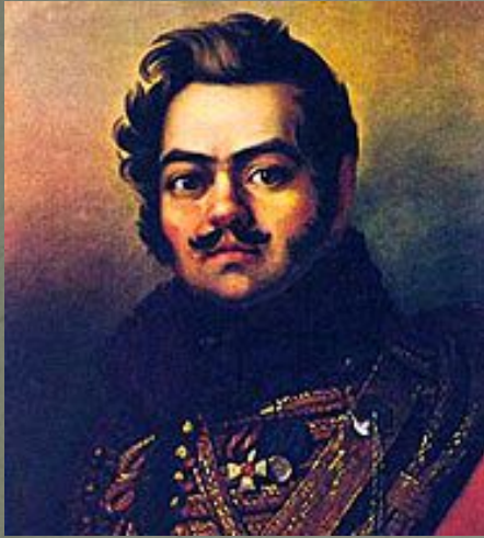
Д. В. Давыдов — партизан-герой Отечественной войны 1812 года.