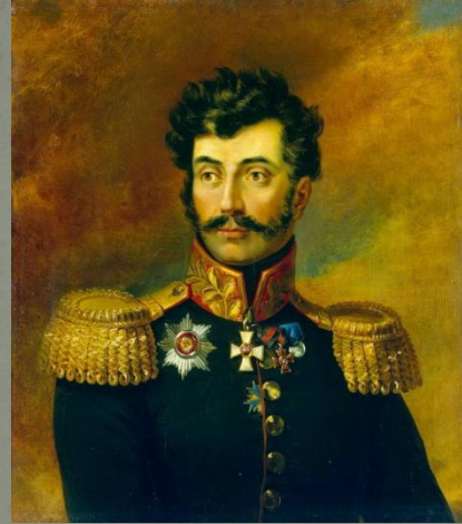
Р.И. Багратион – полководец, герой Отечественной войны 1812 года.