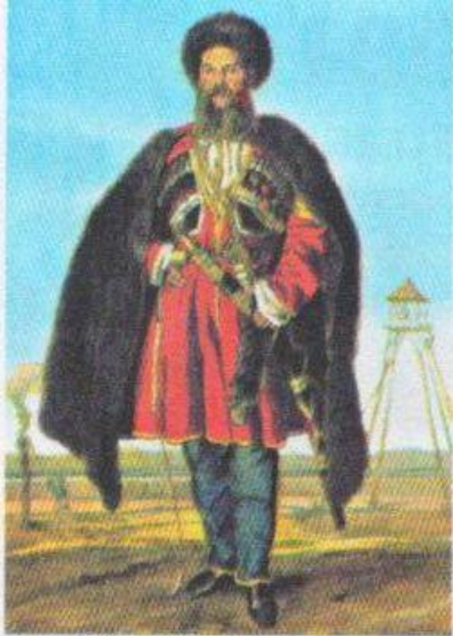
Линейный казак. XIX в.