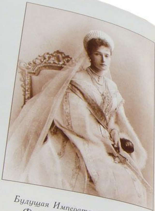
Будущая Императрица Александра Феодоровна Романова, 1894 г.