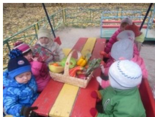
«В гости к бабушке Арине»