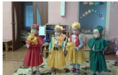
Игра «Осенние листочки»