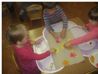
Аппликация «Осенний ковёр»