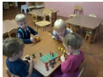
Дидактические игры (с предметами)