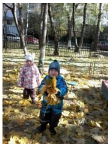
Сбор осенней листвы