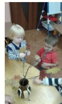
Лепка «Осенние листочки»