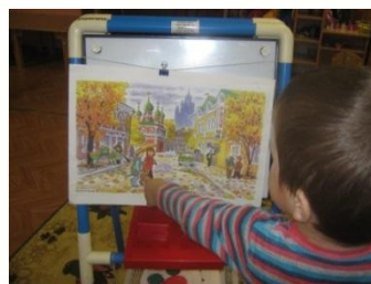
Рассматривание картин, иллюстраций