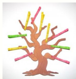
Игры с прищепками