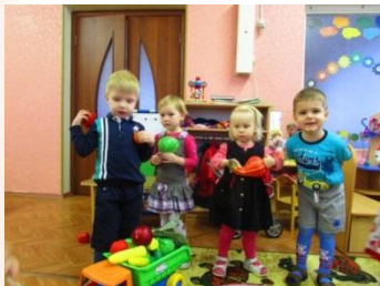
Обыгрывание песенки «Урожай»