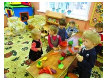
Сюжетно-ролевая игра «Маленькие повара»