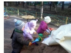
Опытно-экспериментальная деятельность с песком