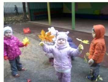
П/и «Такой листок лети ко мне»