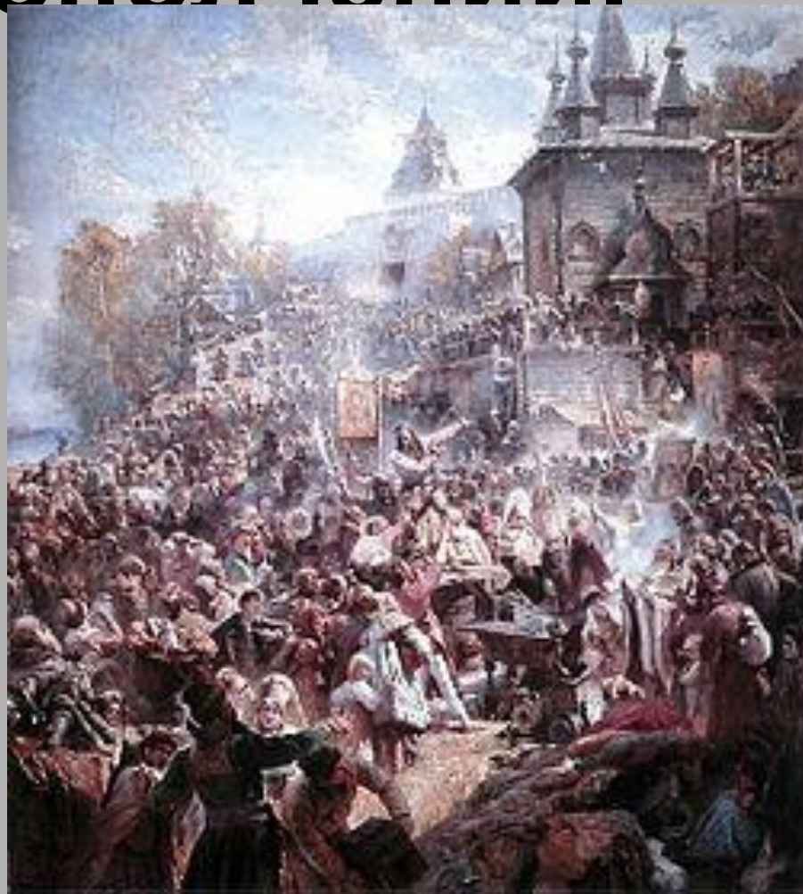
Маковский К. Е. «Воззвание Минина»

1 сентября 1611 года Минин был избран земским старостой и возглавил движение за организацию Второго ополчения.