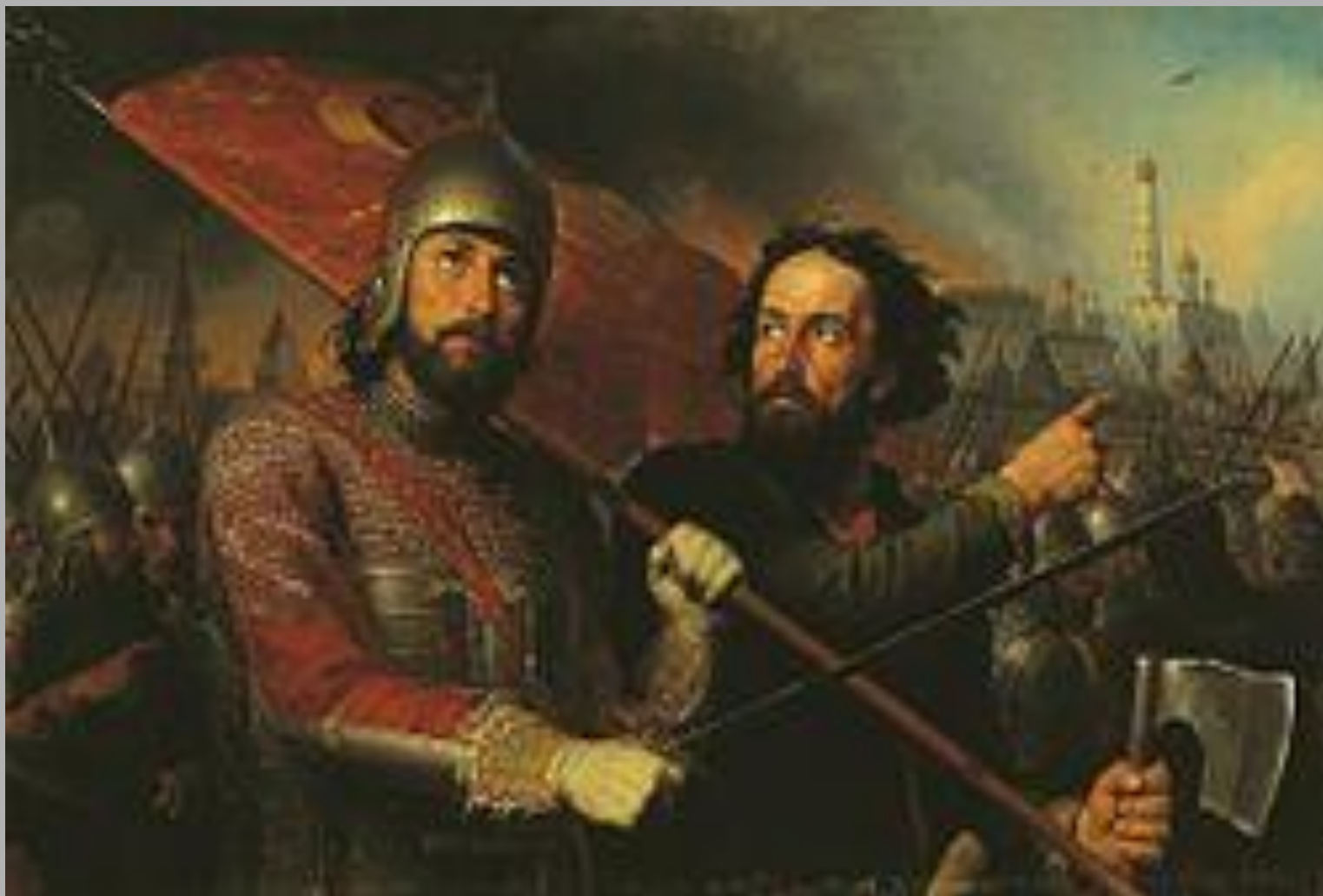
М. И. Скотти «Минин и Пожарский»