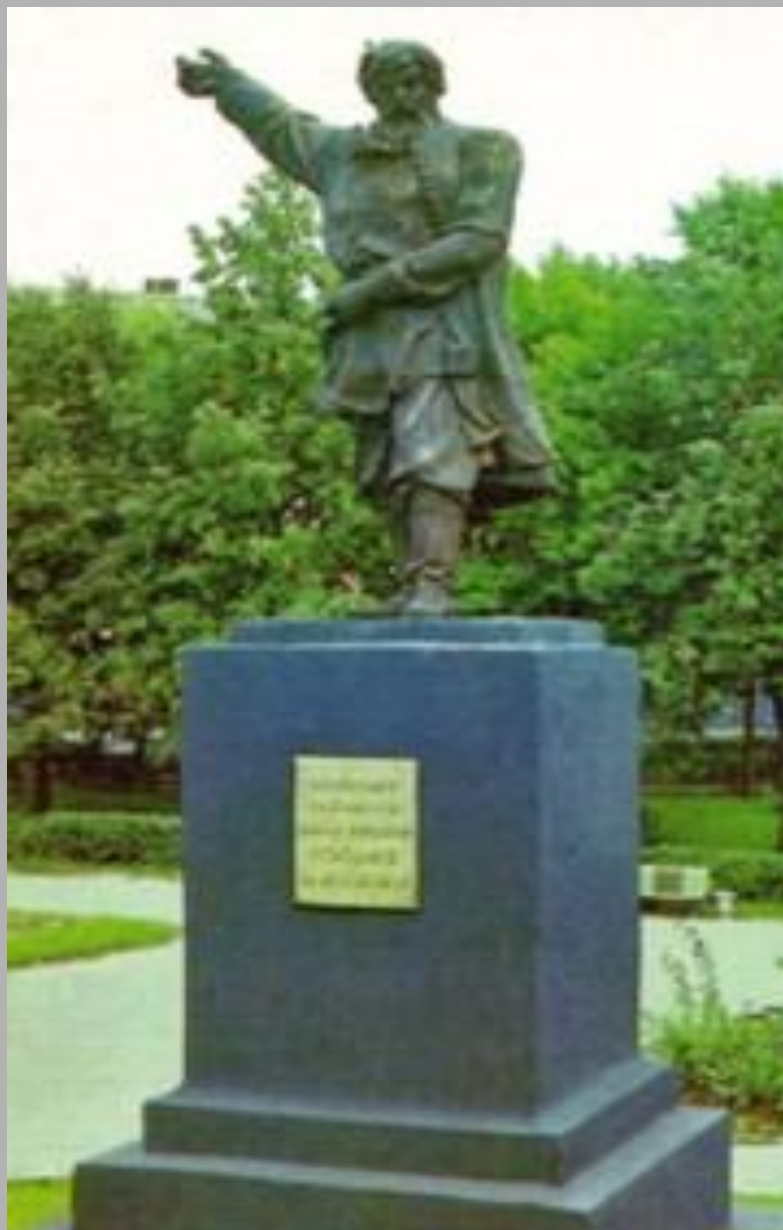
Памятник Кузьме Минину в Городце.