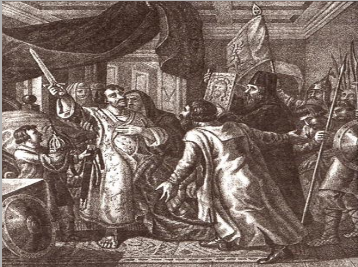
Б.А. Чориков «Призыв Минина к Пожарскому»