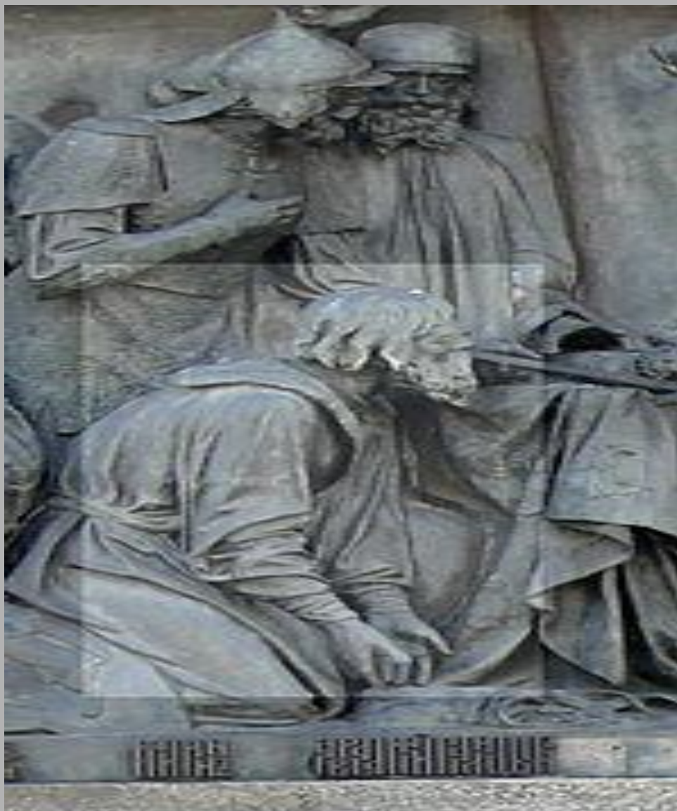
Кузьма Минин на Памятнике «1000-летие России» в Великом Новгороде