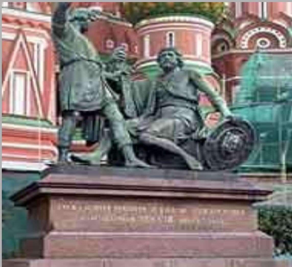
Памятник Минину и Пожарскому в Москве.