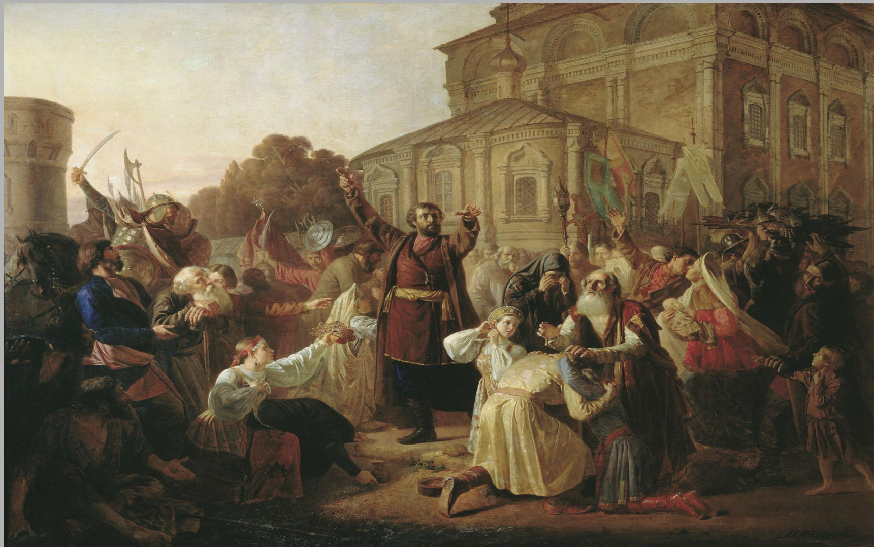
Воззвание Минина к нижегородцам в 1611 году