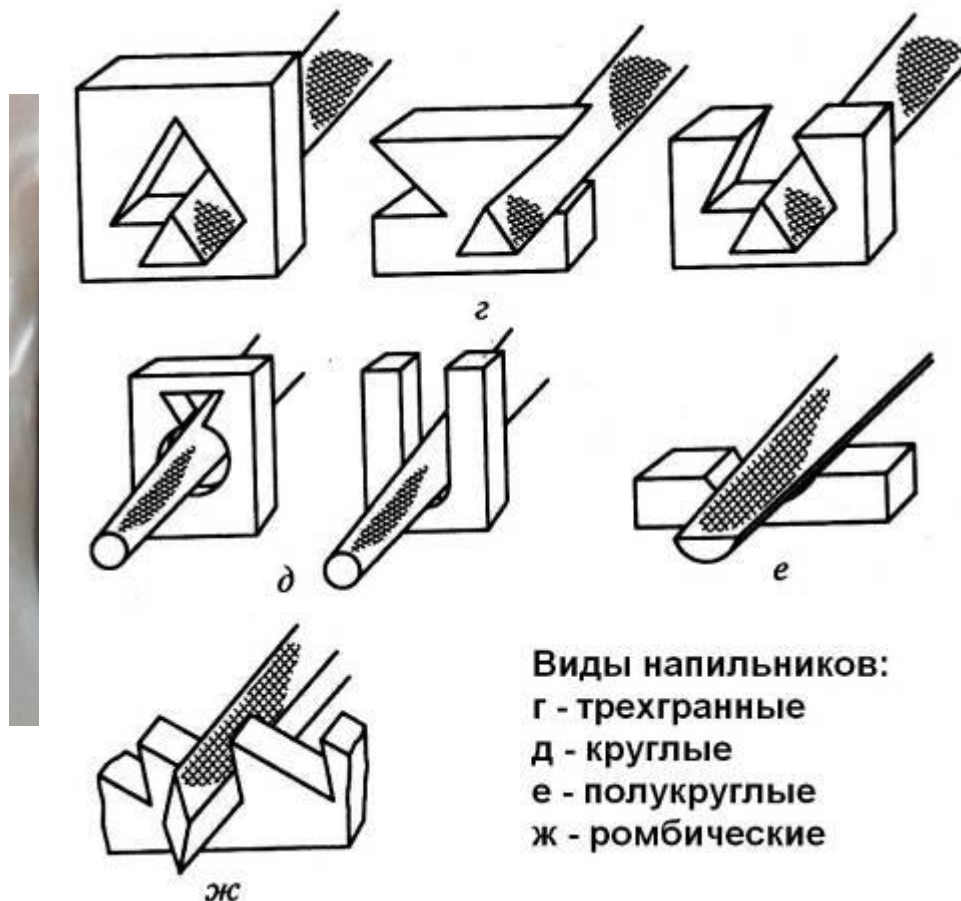
Виды напильников: г - трехгранные д - круглые е - полукруглые ж - ромбические

При изготовлении молотка необходимо выполнить следующие операции: резка, опилование заготовки. При резке заготовки и при её опиловании получается прямоугольник. Для распиливания проёмов различной формы используются напильники разных видов: треугольный, круглый, ромбический, полукруглый.