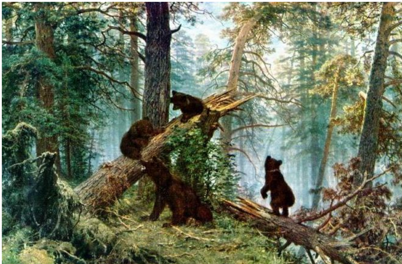
Шишкин «Утро в сосновом лесу»

«...природа вечный образец искусства...» В.В. Белинский