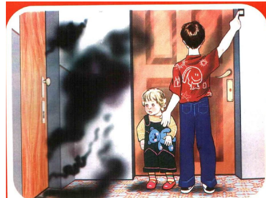
Сообщи о пожаре ближайшим соседям