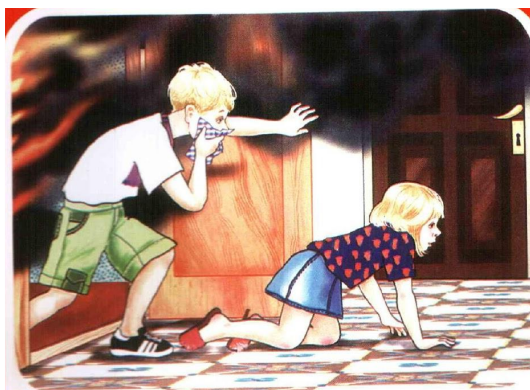
Выбирайся из задымленного помещения ползком