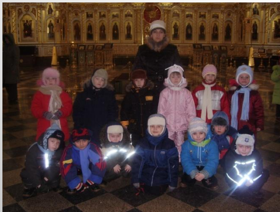
Свято-Федоровский кафедральный собор в честь св. Феодора Ушакова