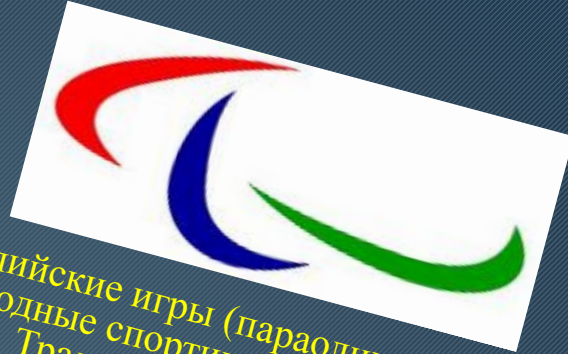
Эмблема параолимпийских игр

Параолимпийские игры (параолимпийские игры) — международные спортивные соревнования для инвалидов. Традиционно проводятся после главных Олимпийских игр, а начиная с 1992 — в тех же городах; в 2001 эта практика закреплена соглашением между МОК и Международным паралимпийским комитетом (МПК). Летние паралимпийские игры проводятся с 1960, а зимние паралимпийские игры — с 1976.