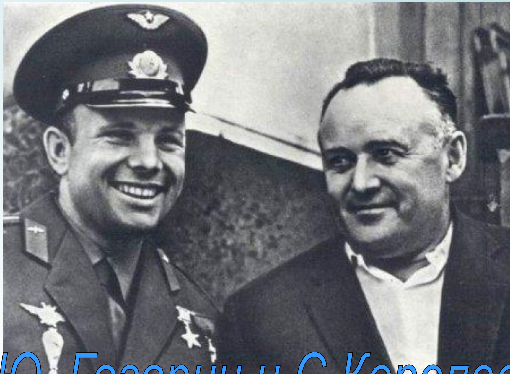
Ю. Гагарин и С. Королев