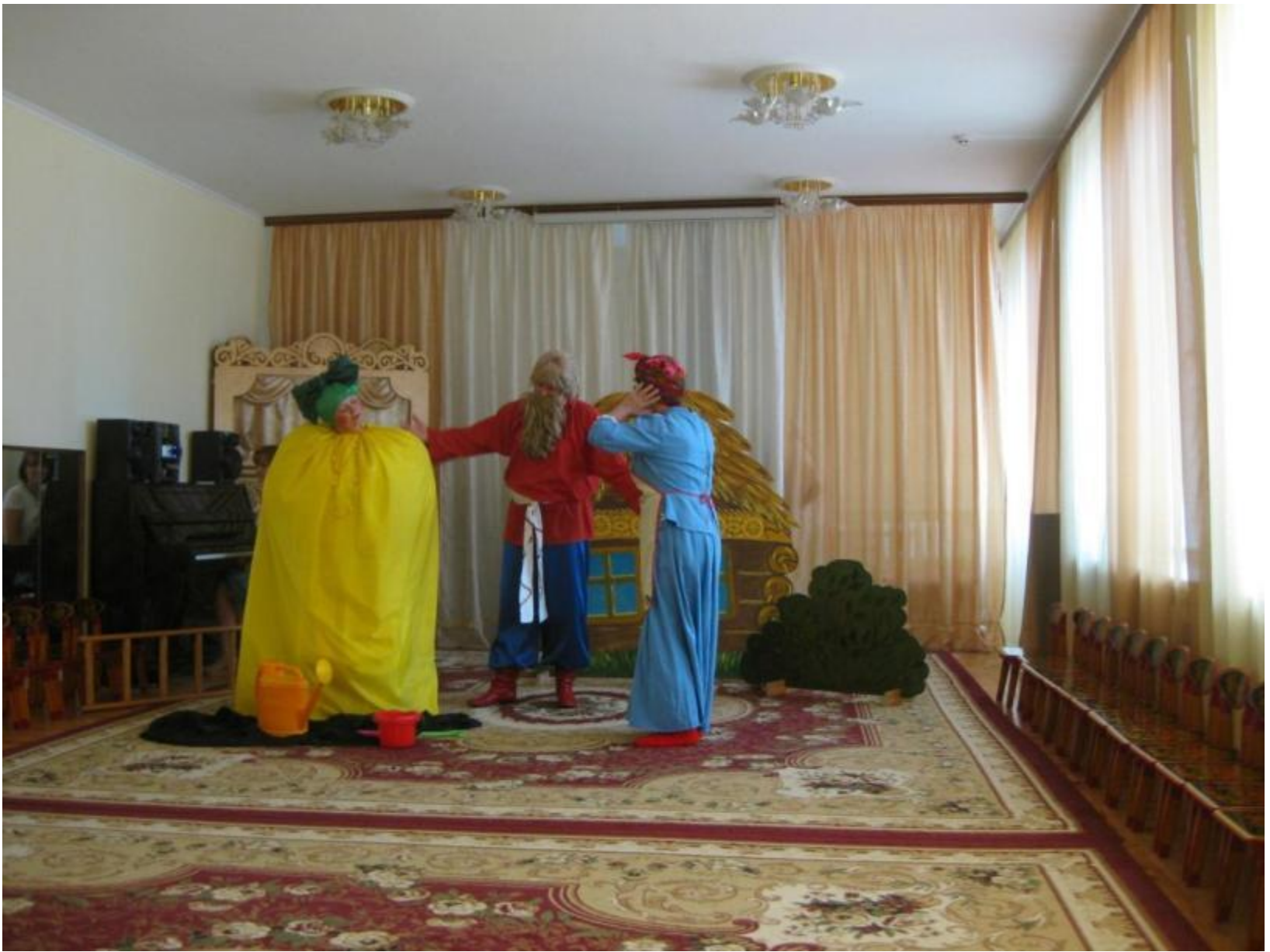
Сказка «Репка» на английском языке (внутрисадовское телевидение «Теленяня»)