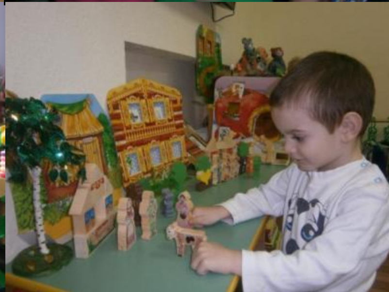
Знакомим детей русскими фольклором