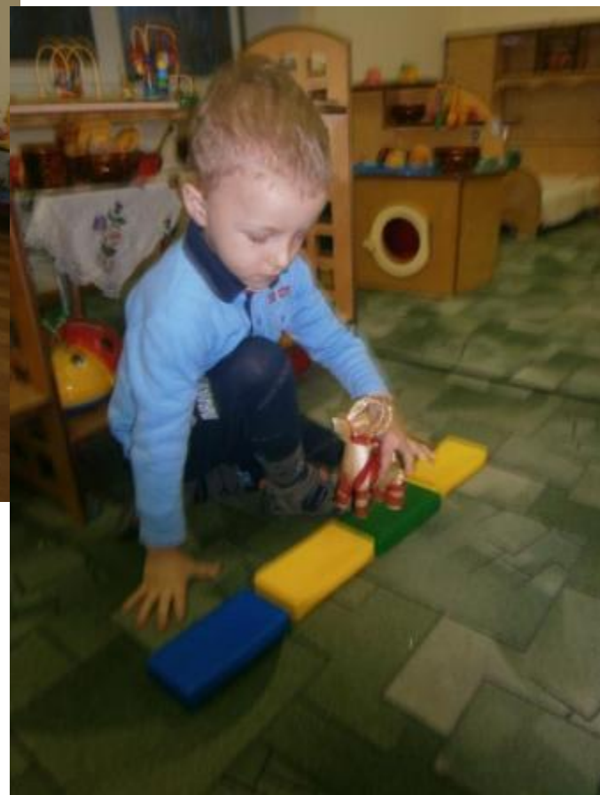
Ознакомление детей с народной игрушкой