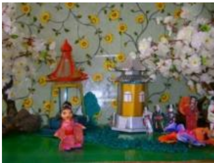
Кружок «Пластилиновая сказка»