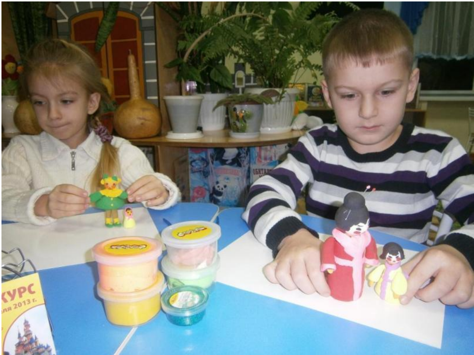
«Мамы и дети разных стран – лепка»