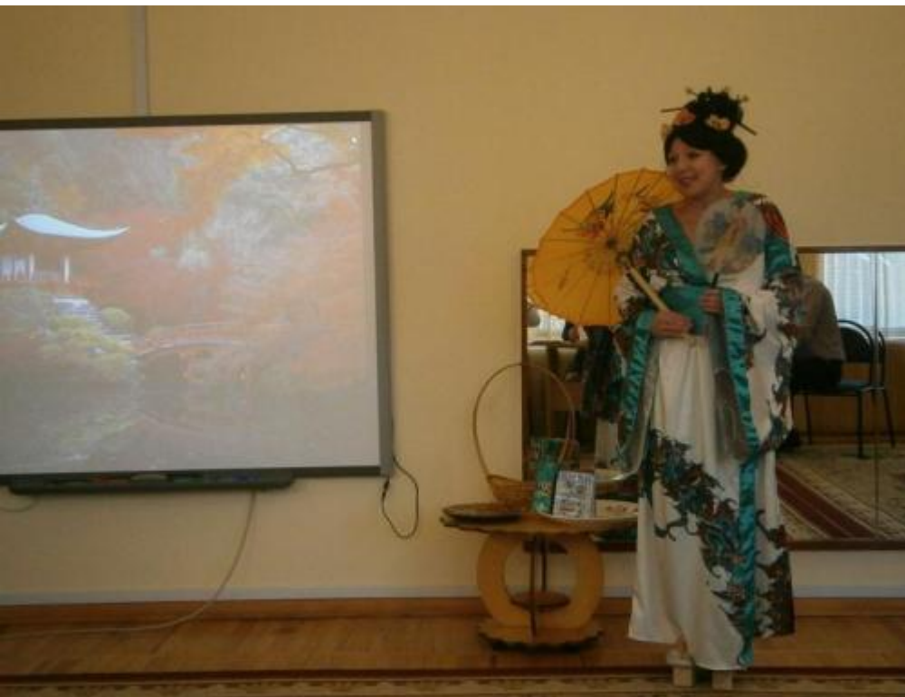
Чтение стихов на японском языке