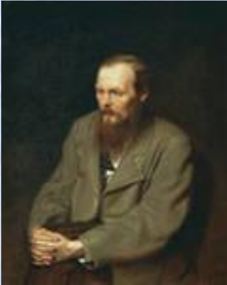
В. Г. Перов «Портрет Достоевского»