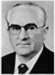
Николай Подгорный ПОДГОРНЫЙ Член Политбюро ЦК КПСС сентябрь 1962 - август 1965