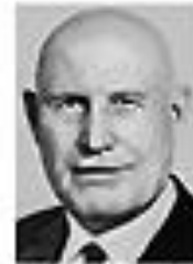
Николай Фоменко ФОМЕНКО Член Политбюро ЦК КПСС сентябрь 1962 - август 1965

Политбюро Центрального комитета КПСС времен «застоя»