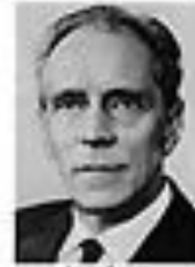
Николай Жигалов ЖИГАЛОВ Член Политбюро ЦК КПСС сентябрь 1962 - август 1965