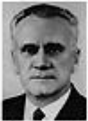
Николай Малаховский МАЛАНОВСКИЙ Член Политбюро ЦК КПСС сентябрь 1962 - август 1965