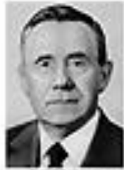
Николай Пузанов ПУЗАНОВ Член Политбюро ЦК КПСС сентябрь 1962 - август 1965