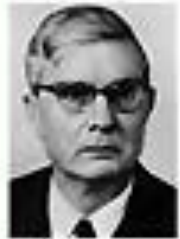
Николай Анисимов АНИСИМОВ Член Политбюро ЦК КПСС сентябрь 1962 - август 1965