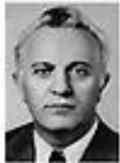
Николай Иванов ИВАНОВ Член Политбюро ЦК КПСС сентябрь 1962 - август 1965