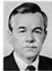
Николай Кравченко КРАВЧЕНКО Член Политбюро ЦК КПСС сентябрь 1962 - август 1965