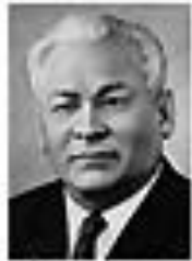
Николай Кравченко КРАВЧЕНКО Член Политбюро ЦК КПСС сентябрь 1962 - август 1965