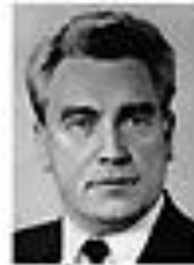
Николай Жигалов ЖИГАЛОВ Член Политбюро ЦК КПСС сентябрь 1962 - август 1965