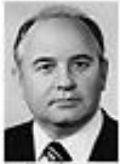
Николай Ситаров СИТАРОВ Член Политбюро ЦК КПСС сентябрь 1962 - август 1965