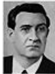
Николай Щеголев ЩЕГОЛЕВ Член Политбюро ЦК КПСС сентябрь 1962 - август 1965