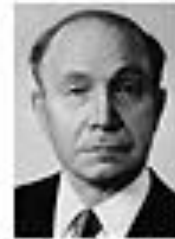
Николай Фоменко ФОМЕНКО Член Политбюро ЦК КПСС сентябрь 1962 - август 1965