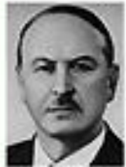
Николай Кравченко КРАВЧЕНКО Член Политбюро ЦК КПСС сентябрь 1962 - август 1965