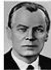
Николай Жигалов ЖИГАЛОВ Член Политбюро ЦК КПСС сентябрь 1962 - август 1965