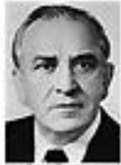
Николай Иванов ИВАНОВ Член Политбюро ЦК КПСС сентябрь 1962 - август 1965