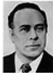
Николай Анисимов АНИСИМОВ Член Политбюро ЦК КПСС сентябрь 1962 - август 1965