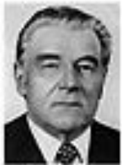
Николай Ситаров СИТАРОВ Член Политбюро ЦК КПСС сентябрь 1962 - август 1965