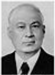
Николай Подгорный ПОДГОРНЫЙ Член Политбюро ЦК КПСС сентябрь 1962 - август 1965