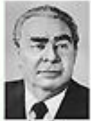
Леонид Брежнев БРЕЖНЕВ Член Политбюро ЦК КПСС сентябрь 1962 - август 1982