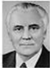
Николай Беликовский БЕЛИКОВСКИЙ Член Политбюро ЦК КПСС сентябрь 1962 - август 1965