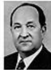
Николай Кравченко КРАВЧЕНКО Член Политбюро ЦК КПСС сентябрь 1962 - август 1965