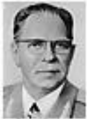
Николай Жуковский ЖУКОВСКИЙ Член Политбюро ЦК КПСС сентябрь 1962 - август 1965