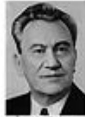
Николай Кравченко КРАВЧЕНКО Член Политбюро ЦК КПСС сентябрь 1962 - август 1965