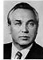
Николай Фоменко ФОМЕНКО Член Политбюро ЦК КПСС сентябрь 1962 - август 1965