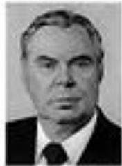
Николай Пузанов ПУЗАНОВ Член Политбюро ЦК КПСС сентябрь 1962 - август 1965