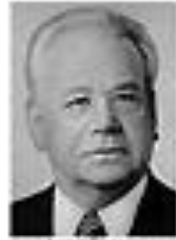
Николай Щеголев ЩЕГОЛЕВ Член Политбюро ЦК КПСС сентябрь 1962 - август 1965