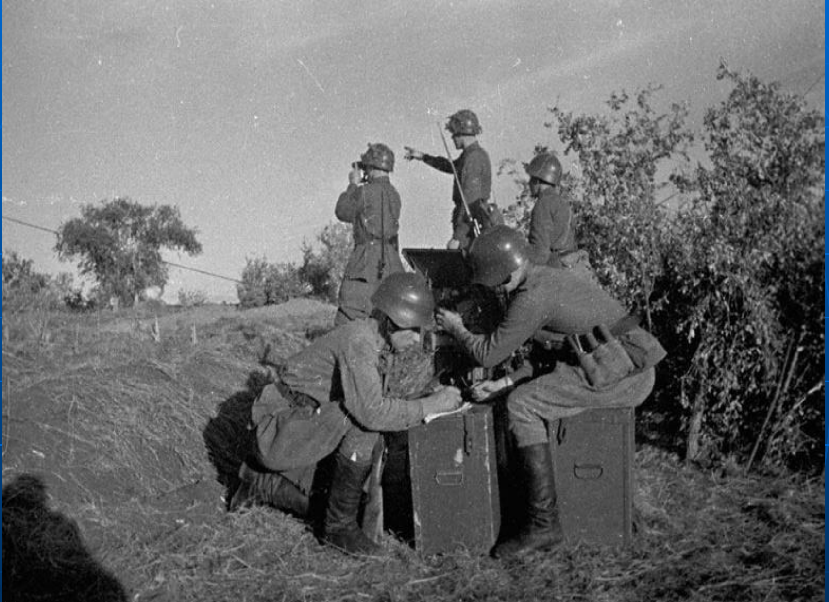
На наблюдательном пункте.