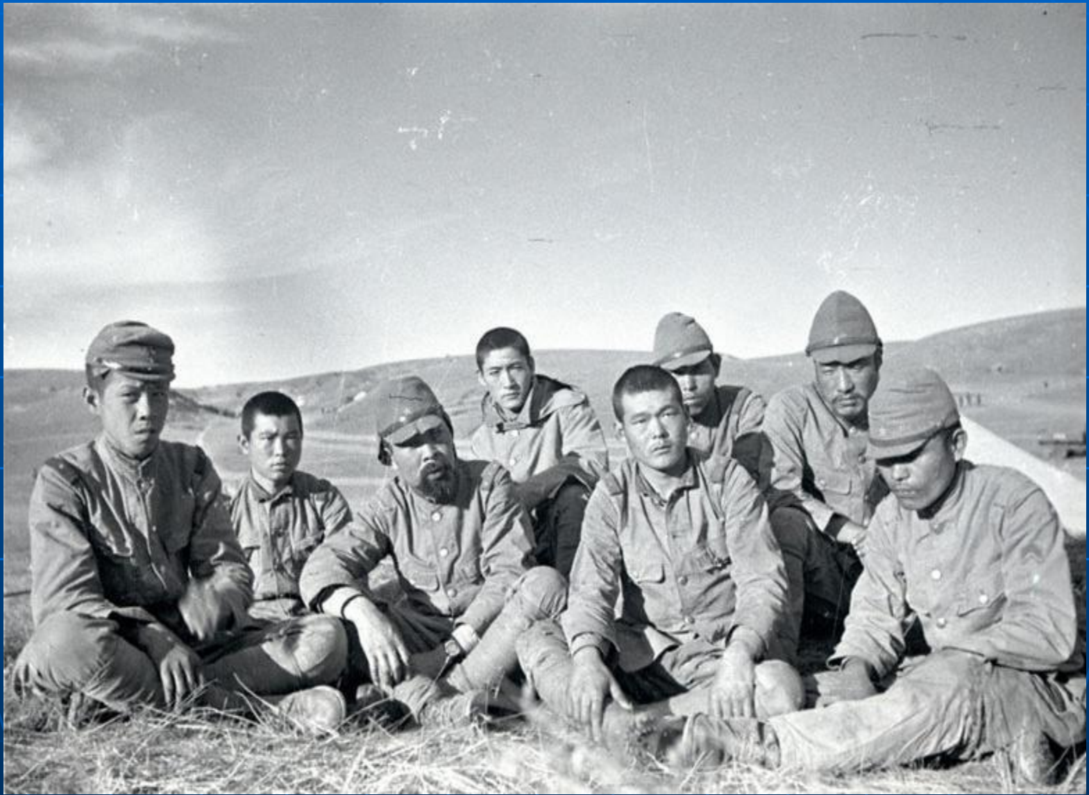
Пленные на отдыхе.