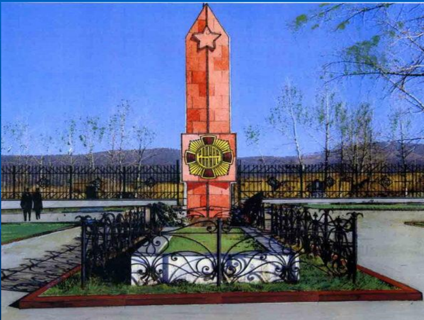
Памятник Погибшим войнам в Чите.