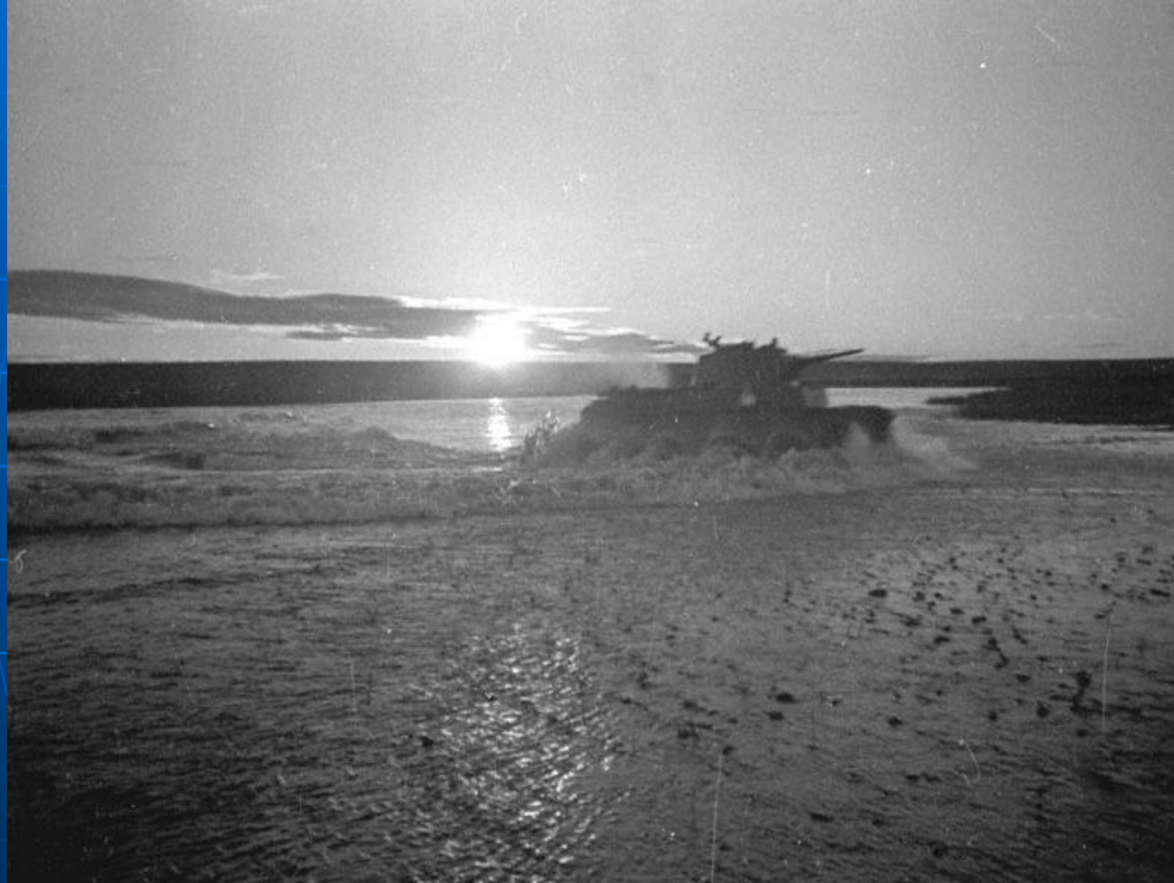
Танк форсирует р.Халхин-гол