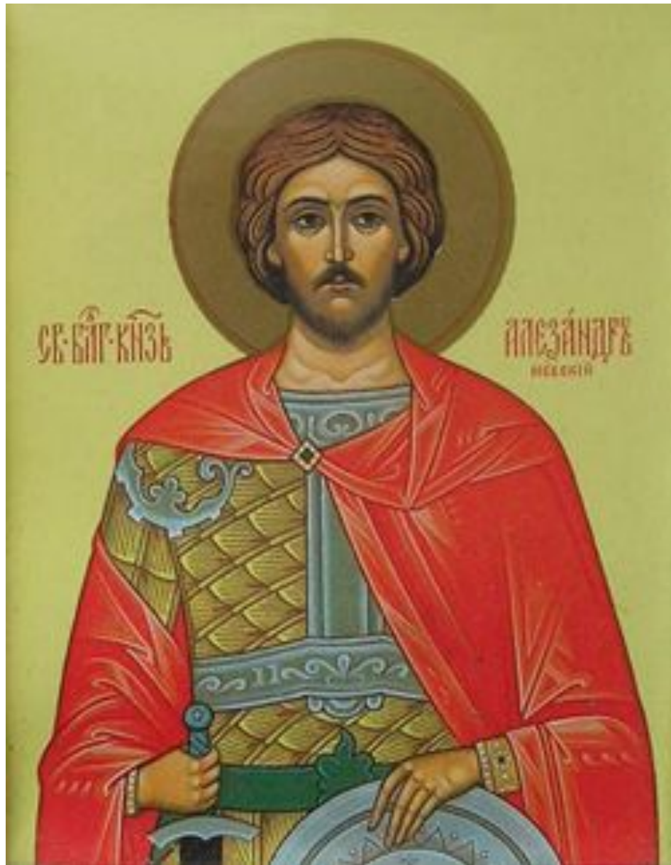
Икона «Святой благочестивый Александр Невский»