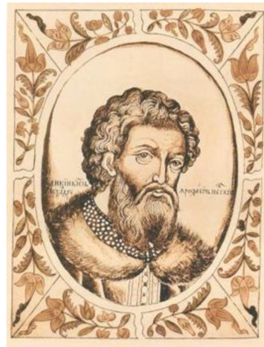
Миниатюра из «Царского титулярника», 1672