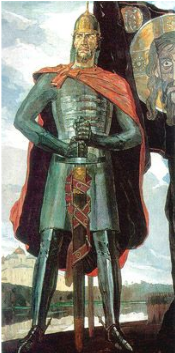
Павел Корин. Александр Невский (1942)