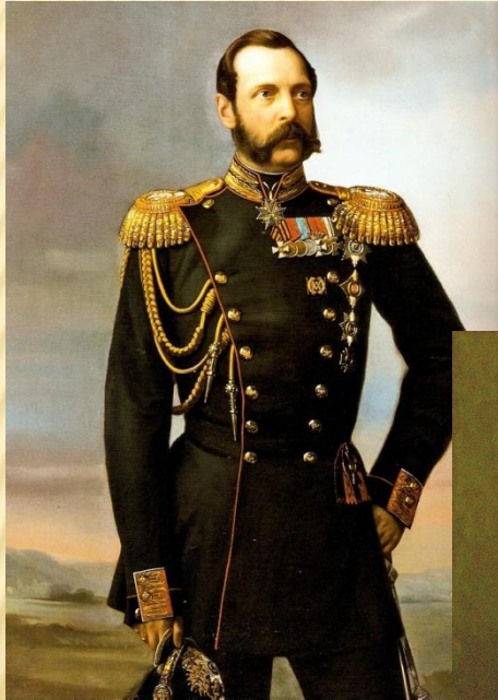
Александр II (1855-1881)