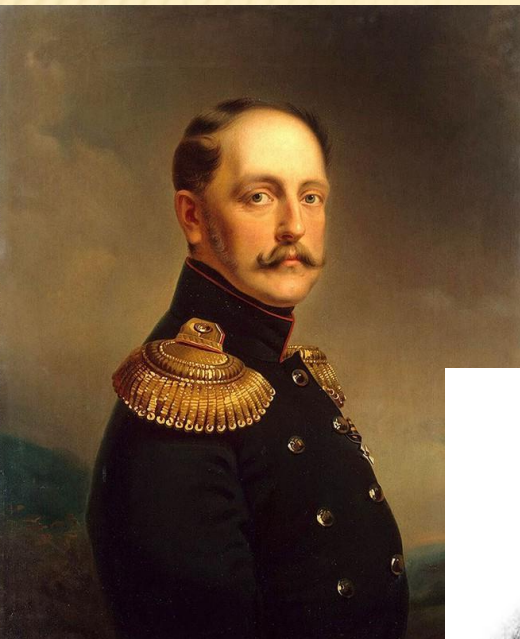
Николай I (1825-1855)