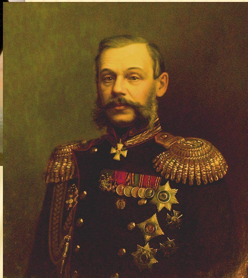
Д.А. Милютин (1816-1912)