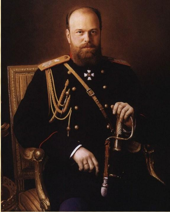
Александр III (1881-1894)