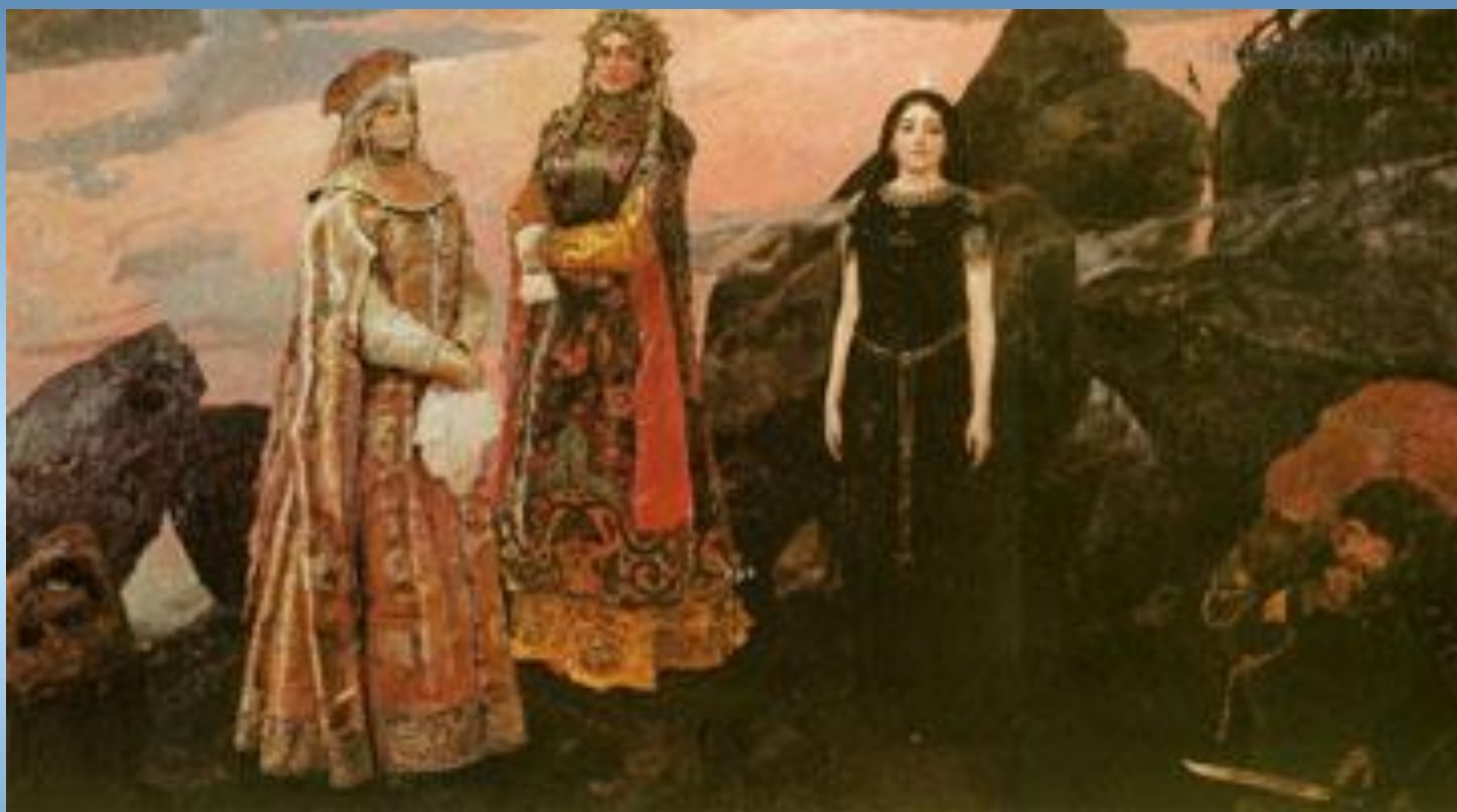
Три царевны подземного царства