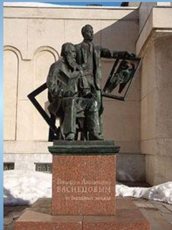
Памятник в Кировской области