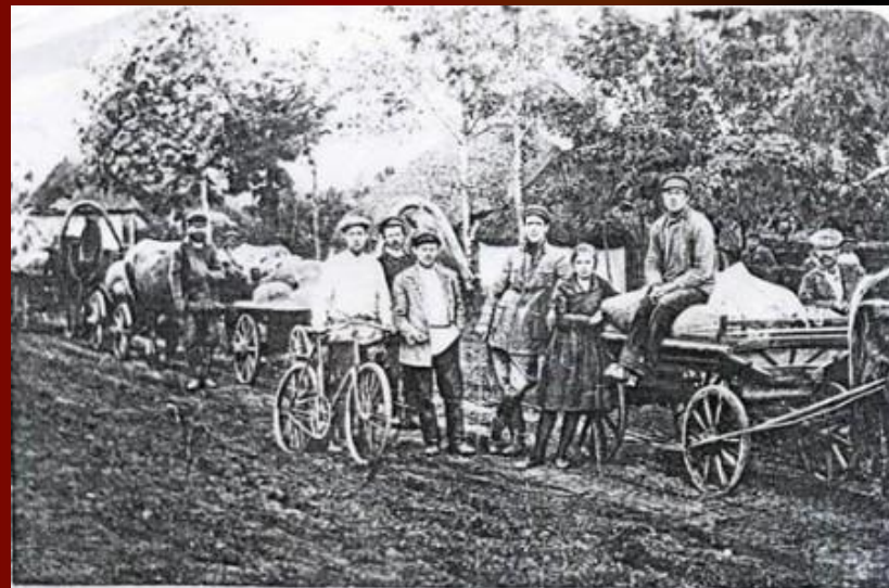
Обоз с зерном, конфискованым у кулаків с. Коломак Валківського району. (30-і роки).