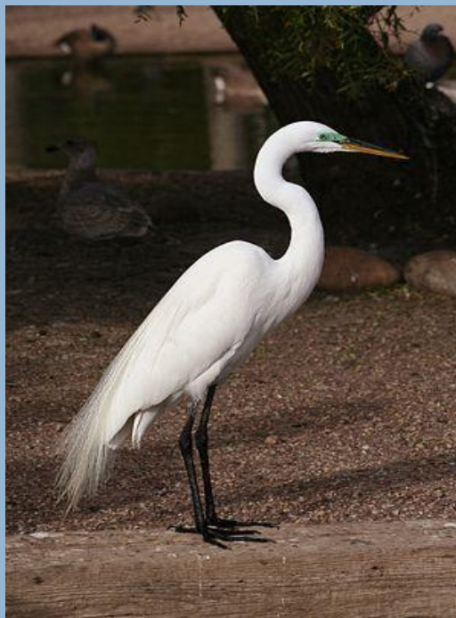
Большая белая цапля