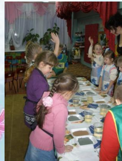
«Послание в будущее»