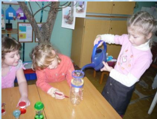
«Как работают водные часы?»