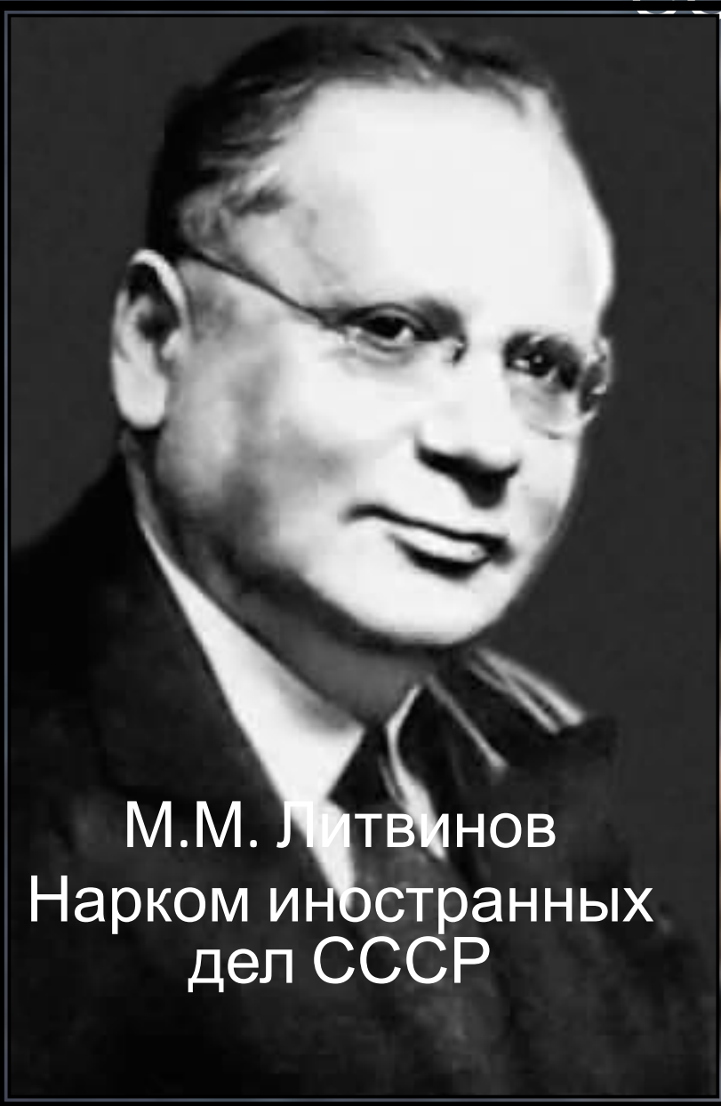
М.М. Литвинов Нарком иностранных дел СССР