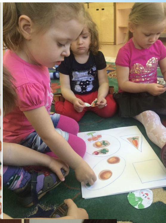
Изучаем формы овощей.