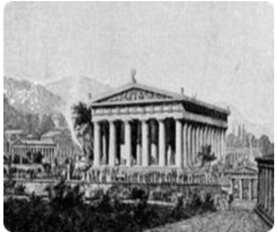
Храм и статуя Зевса в Олимпии