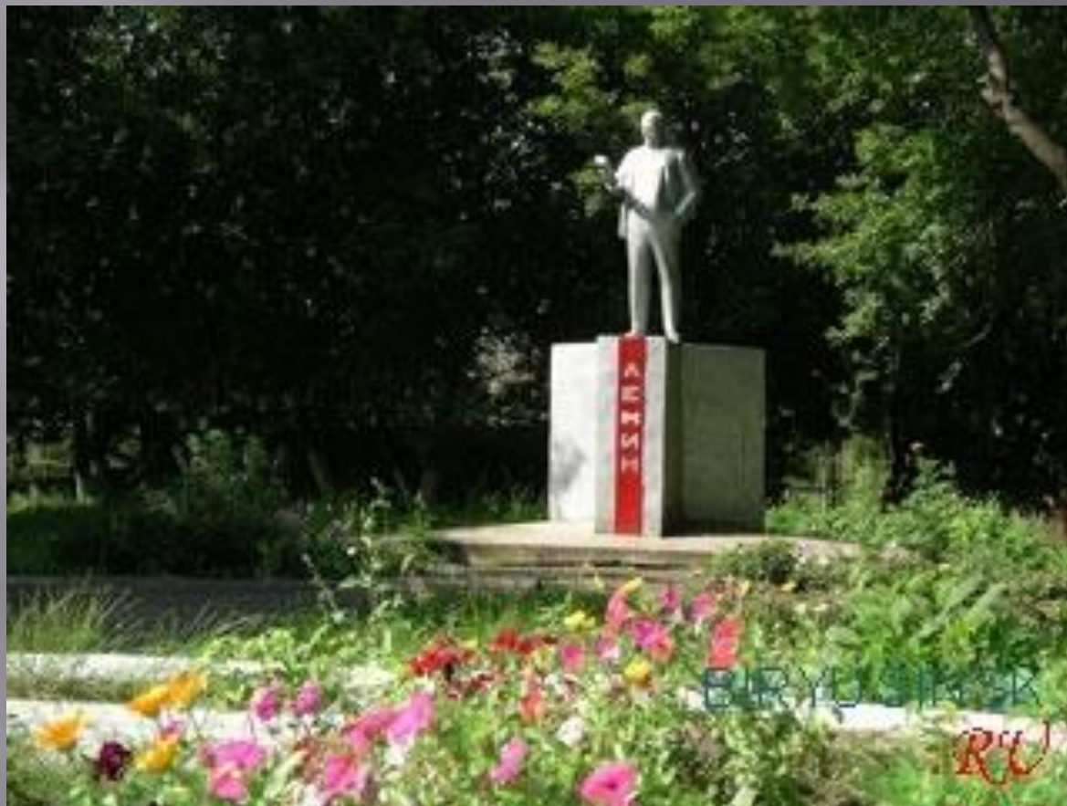
Памятник государственному деятелю Ленину Владимиру Ильичу