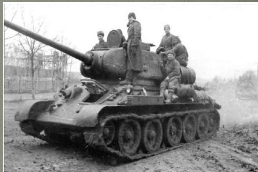
Concord-Russian Medium tanks 1941-1945 (page 47)