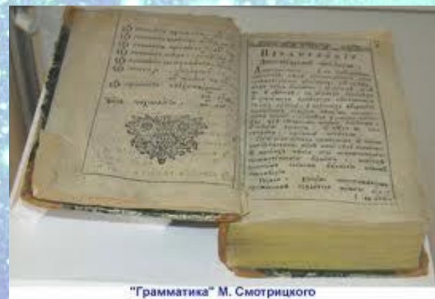
"Грамматика" М. Смотрицкого