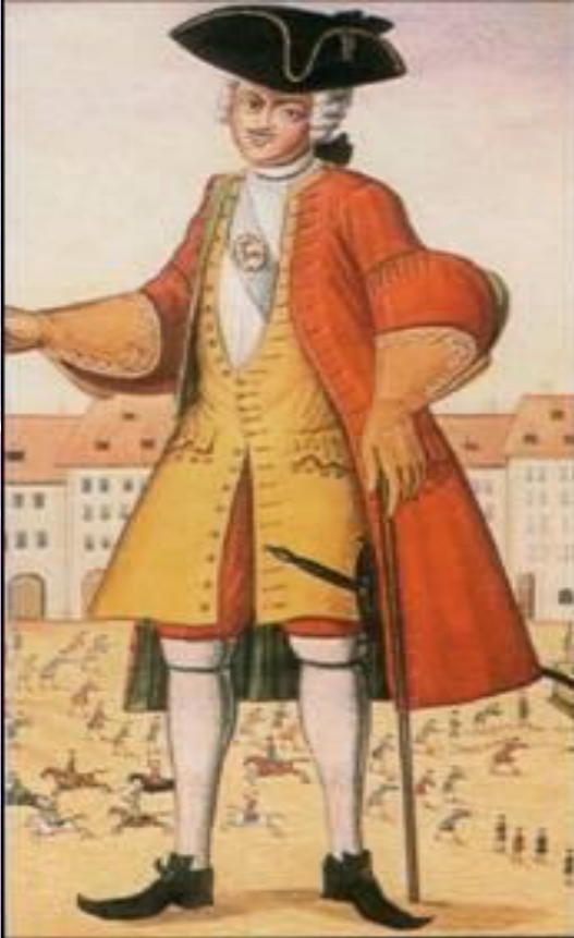
Студент немецкого университета