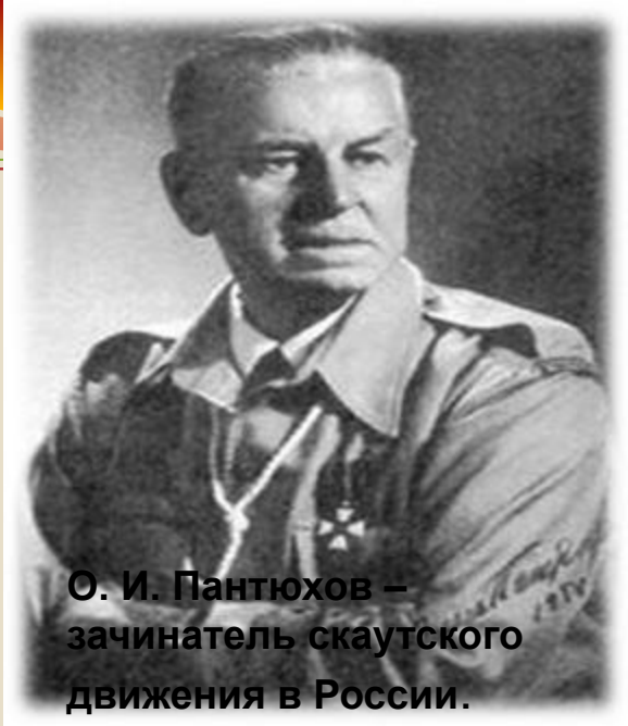
О. И. Пантюхов – зачинатель скаутского движения в России.