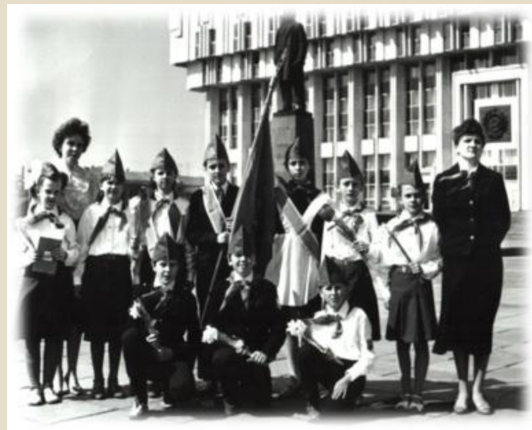
Приём в пионеры 1990г.