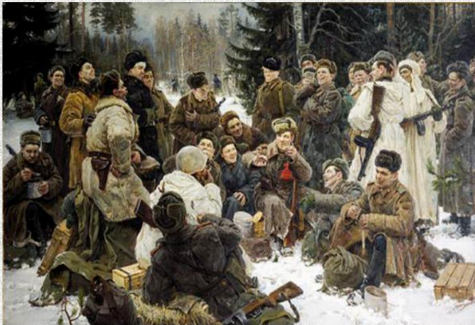
Ю.М. Непринцев «Отдых после боя»