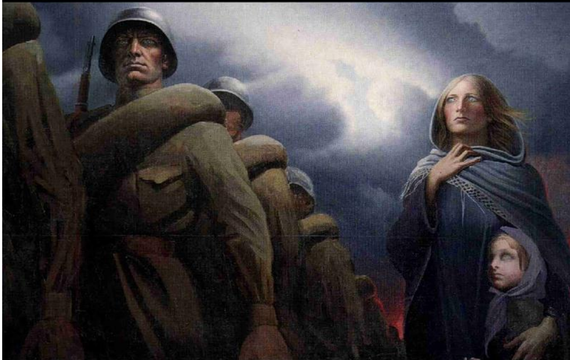
Константин Васильев. Прощание славянки. Холст, масло. 1974