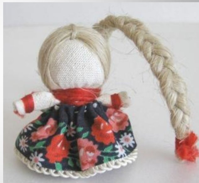
Куколка на здоровье, счастье