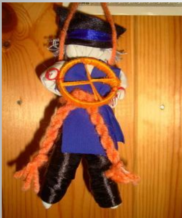
Спиридон - Солнцеворот