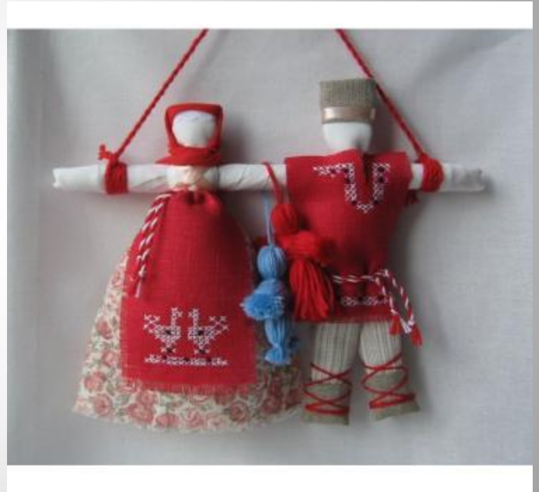
Куклы - Неразлучники