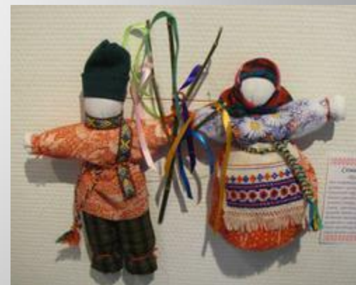
Семик и Семечиха