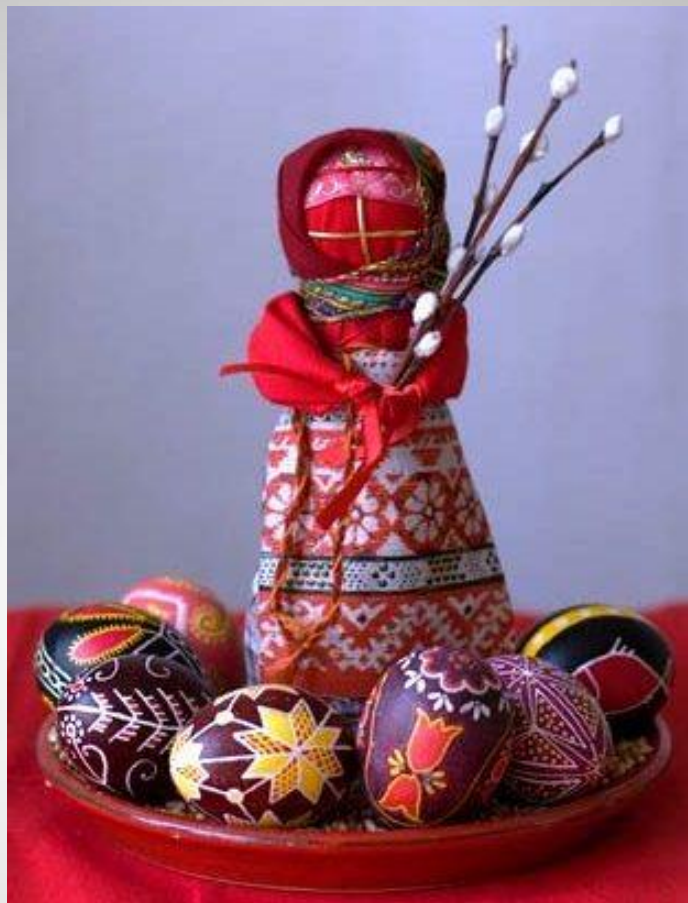
Кукла - Пасха