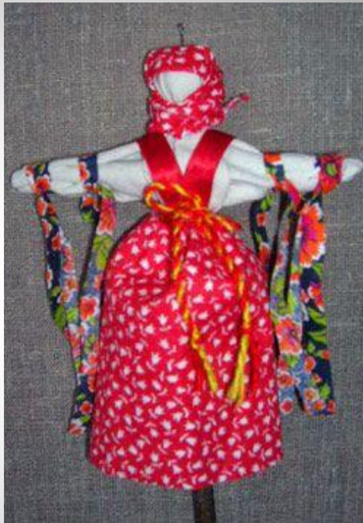
Кукла - Купавка