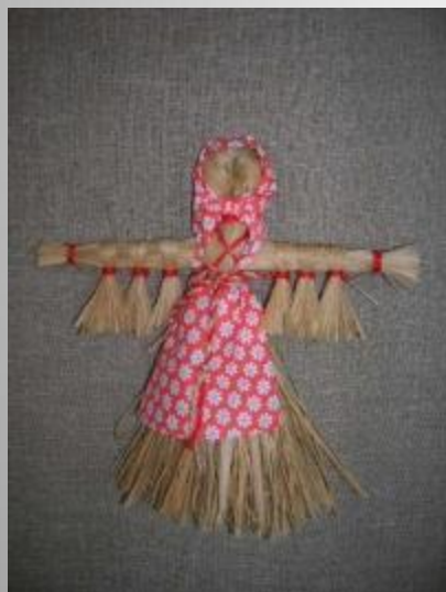
Кукла - Кукушечка