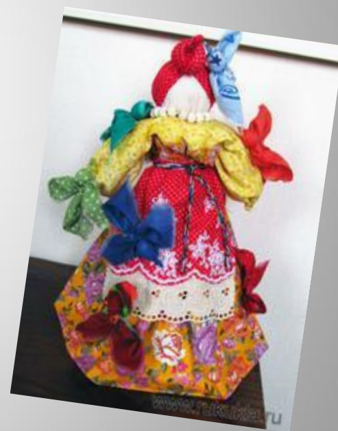
Кукла - Радость