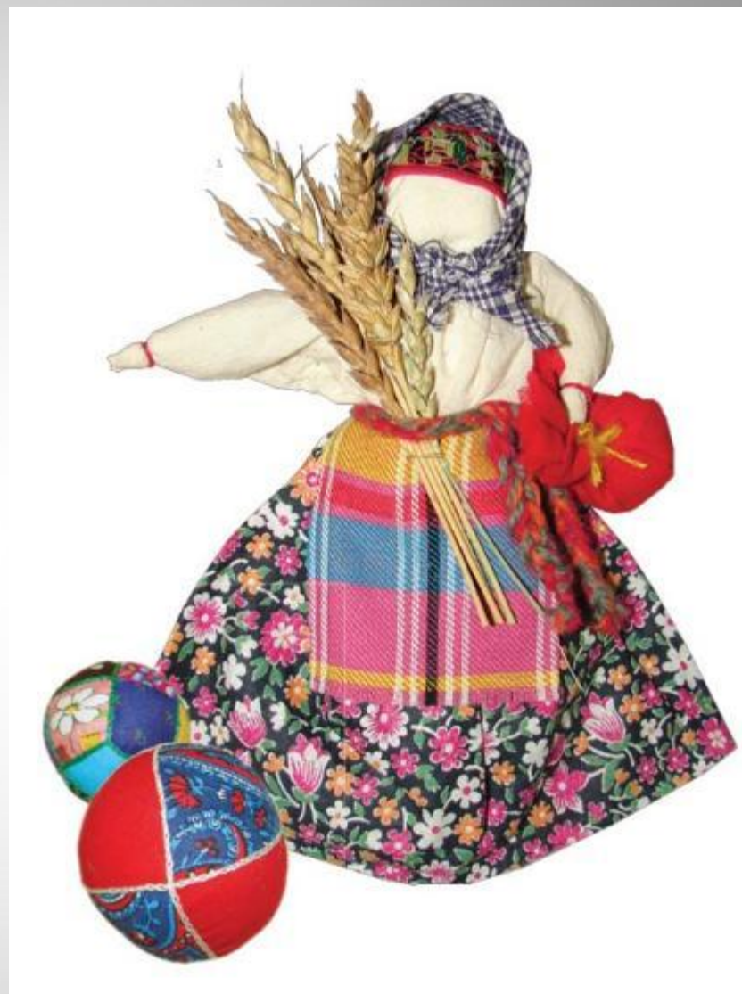
Кукла - Жница