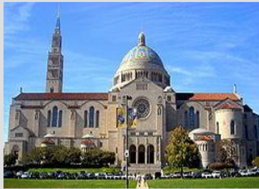
Базилика Непорочного зачатия Пресвятой Девы Марии