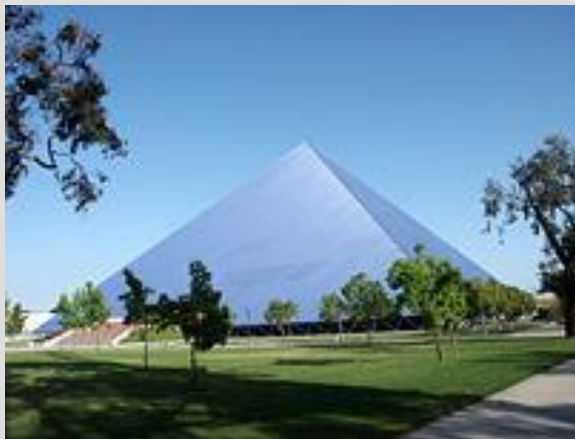
Кампус Университета штата Калифорния, Лонг-Бич

Высшие учебные заведения главным образом частные, которые привлекают студентов и аспирантов со всего мира. Учреждения высшего образования не являются бесплатными и лишь частично содержатся на государственные средства. Вузы поддерживаются благотворительными фондами и средствами богатых покровителей, что позволяет последним оказывать влияние на университетские дела. Уровень грамотности в США — 97 %. Соединенные Штаты являются абсолютным лидером по количеству Нобелевских лауреатов. По состоянию на 2012 год, гражданам США было присвоено 331 Нобелевских премий.