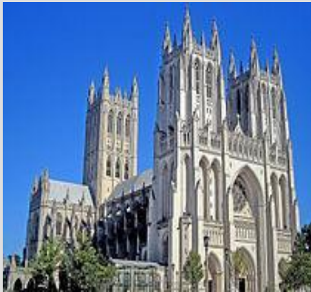
Вашингтонский кафедральный собор

США являются одной из самых религиозных стран развитого мира. Сегодня правительство на национальном, региональном и местном уровнях продвигают принцип разделения церкви и государства. Церковь сегодня имеет большое значение в сознании и жизни американца, хотя оно постоянно сокращается. При церквях часто действуют спортивные, интеллектуальные, образовательные структуры, а здание самой церкви может сдаваться в аренду